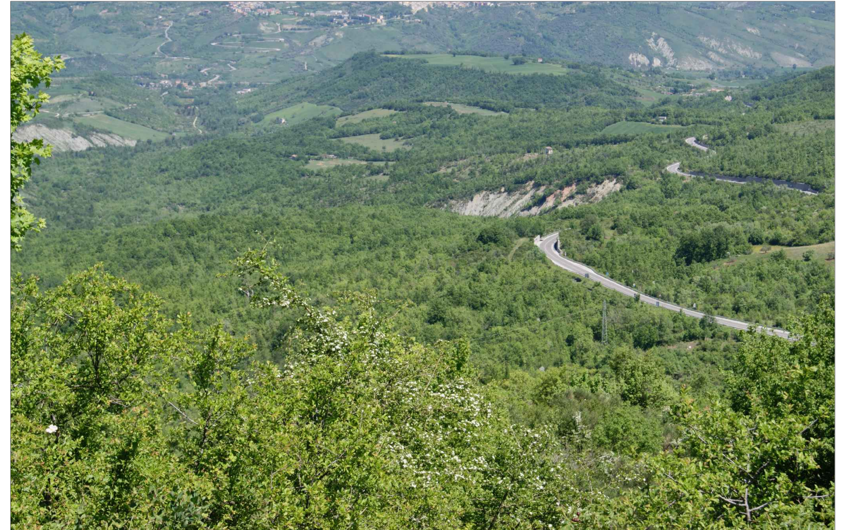
Punto di vista 6.5b - Post Operam