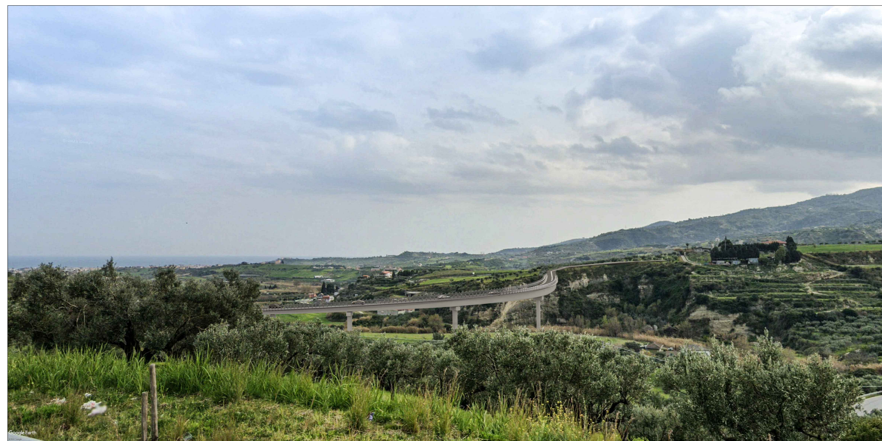
Viadotto Turrity VI03 - Vista 2 - Post operam