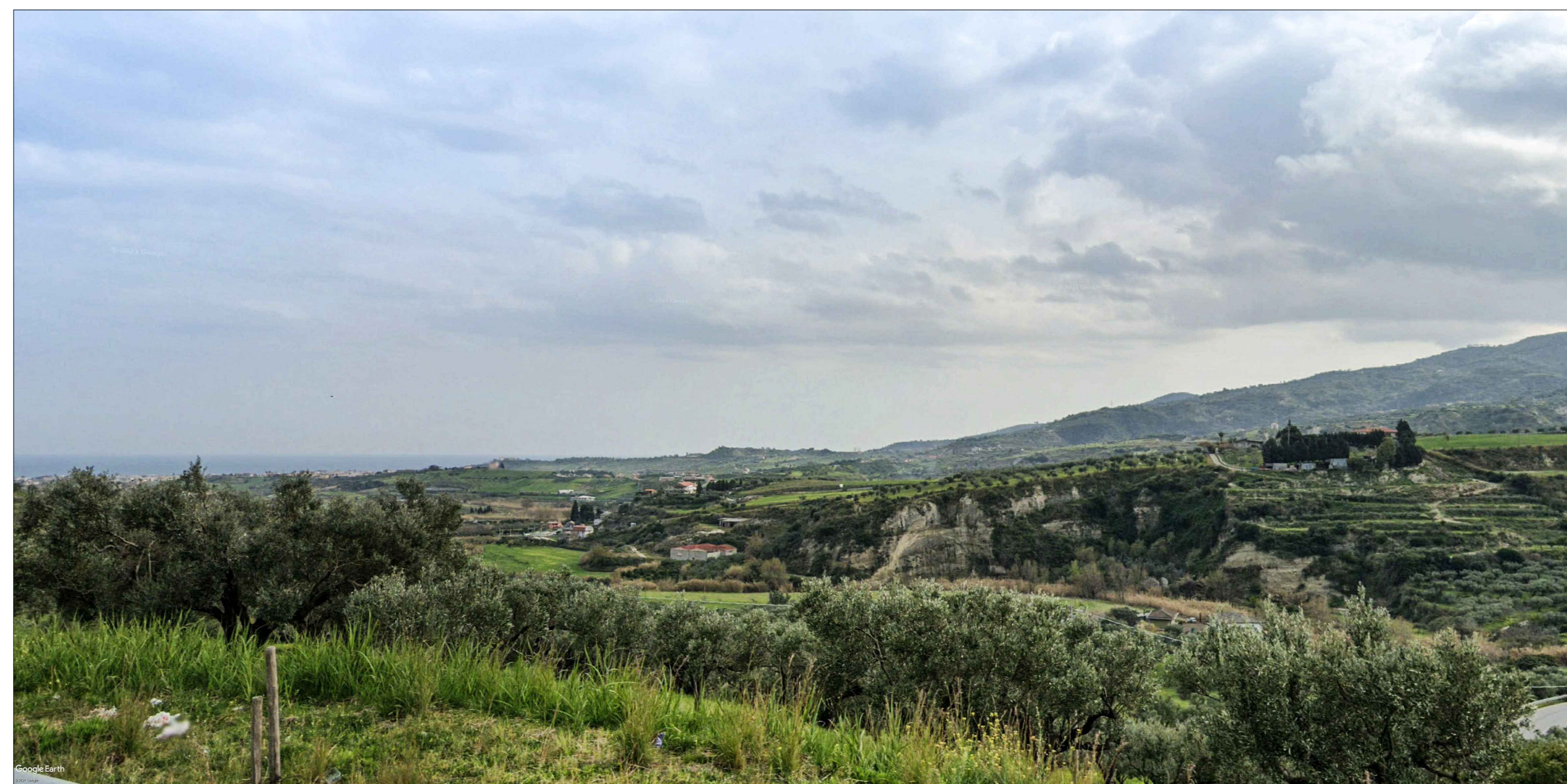
Viadotto Turrity VI03 - Vista 2 - Ante operam