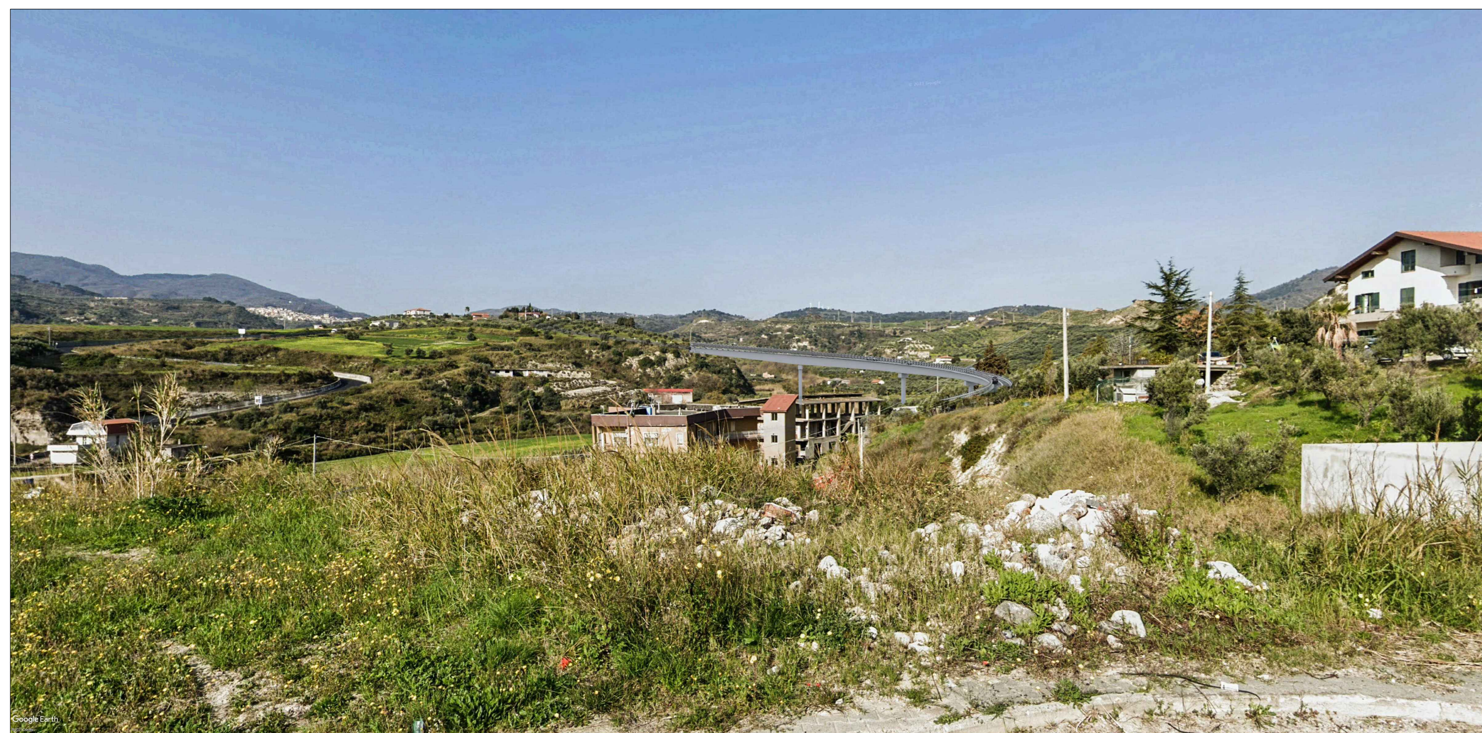
Viadotto Turrity VI03 - Vista 1 - Post operam