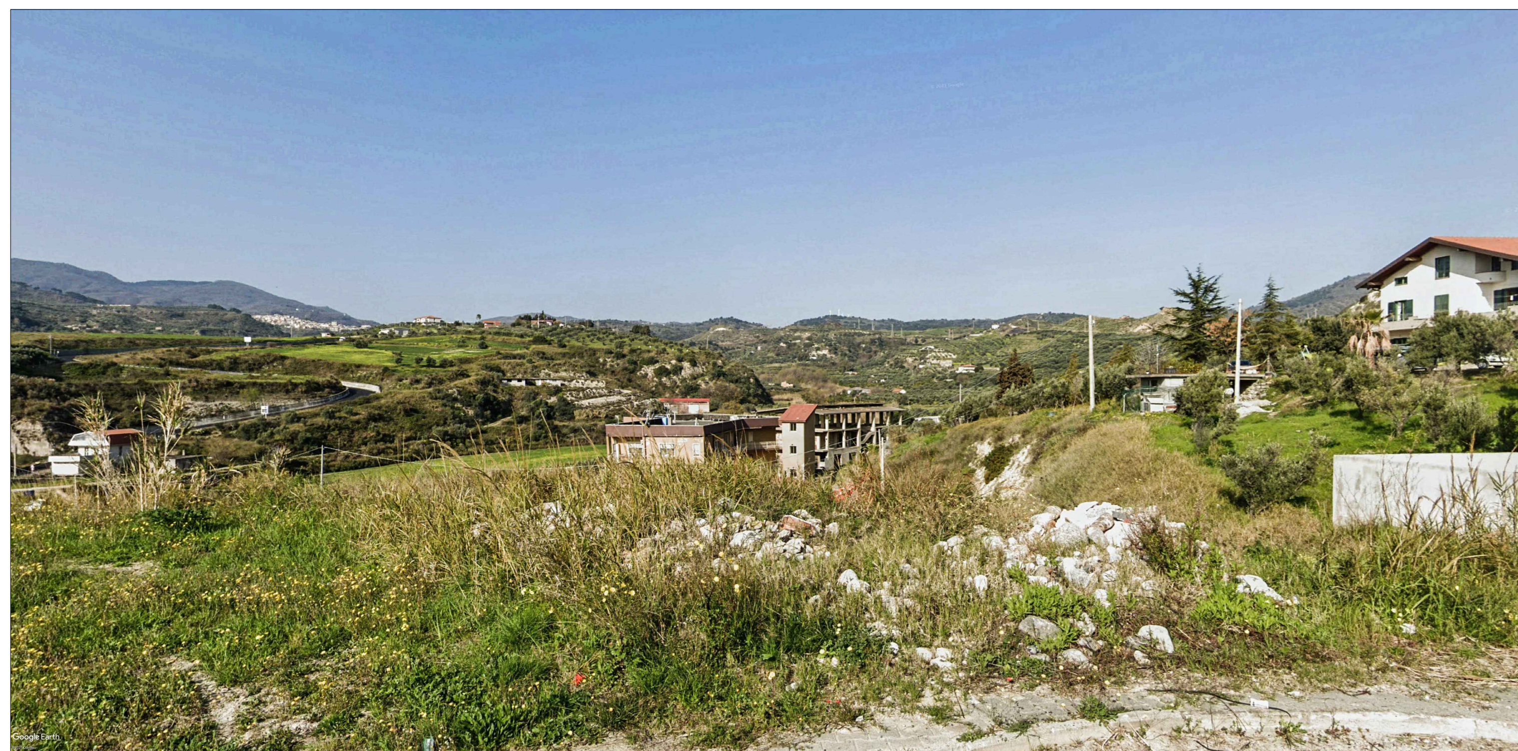
Viadotto Turrity VI03 - Vista 1 - Ante operam