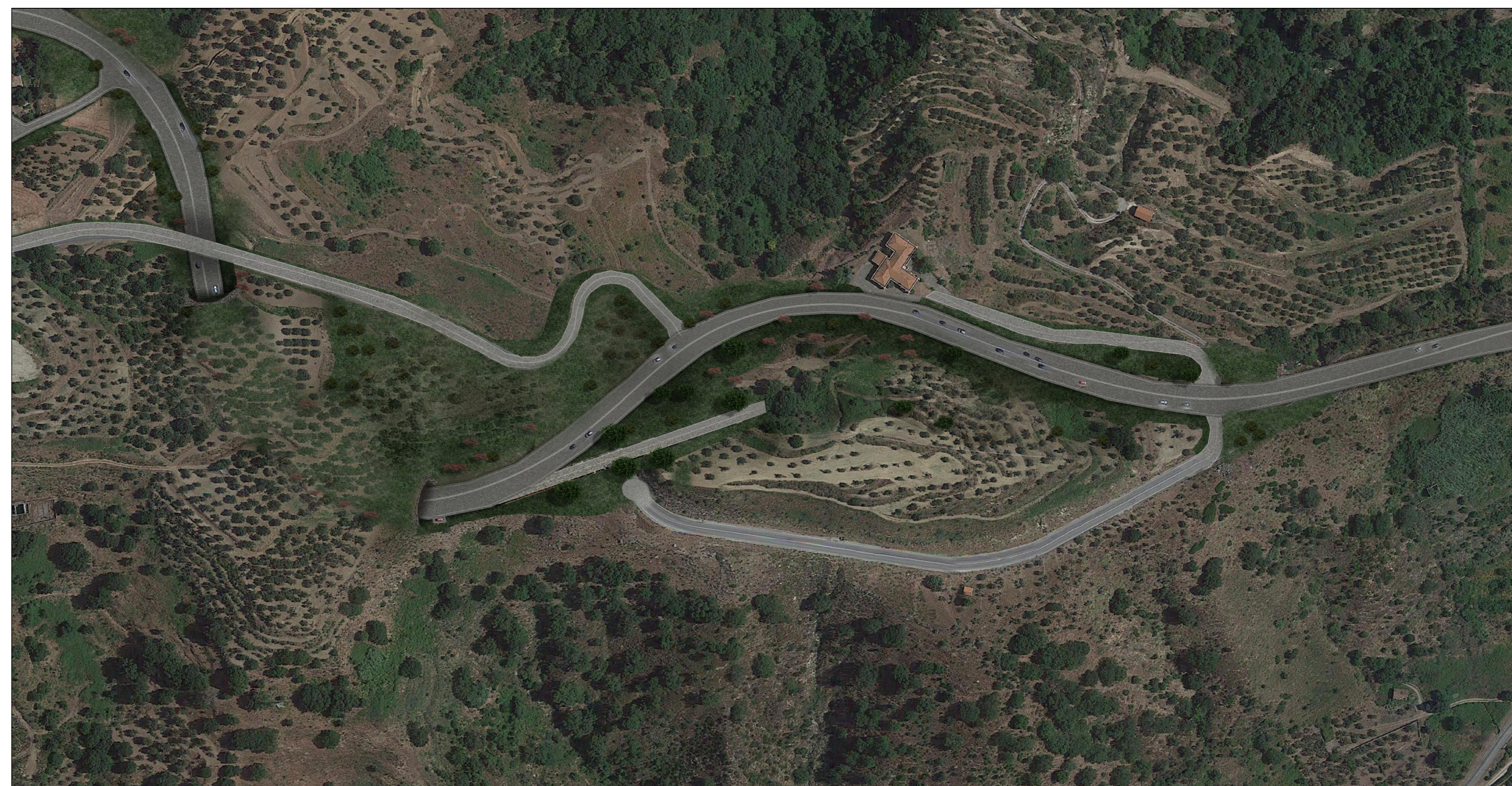
Simulazione su foto aerea - Galleria artificiale GA01 - Post operam