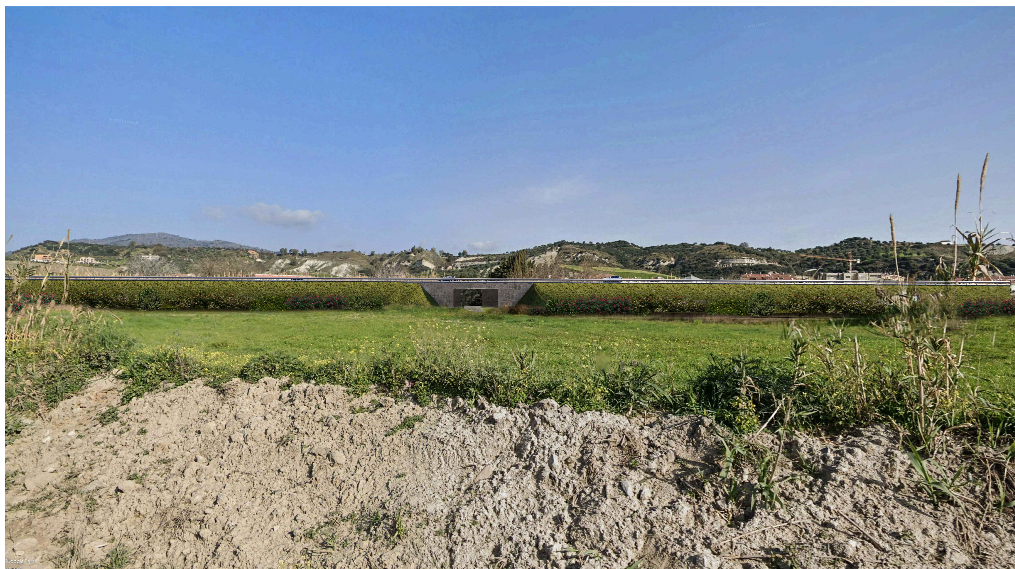
Viadotto VI01 - Vista 3 - Post operam