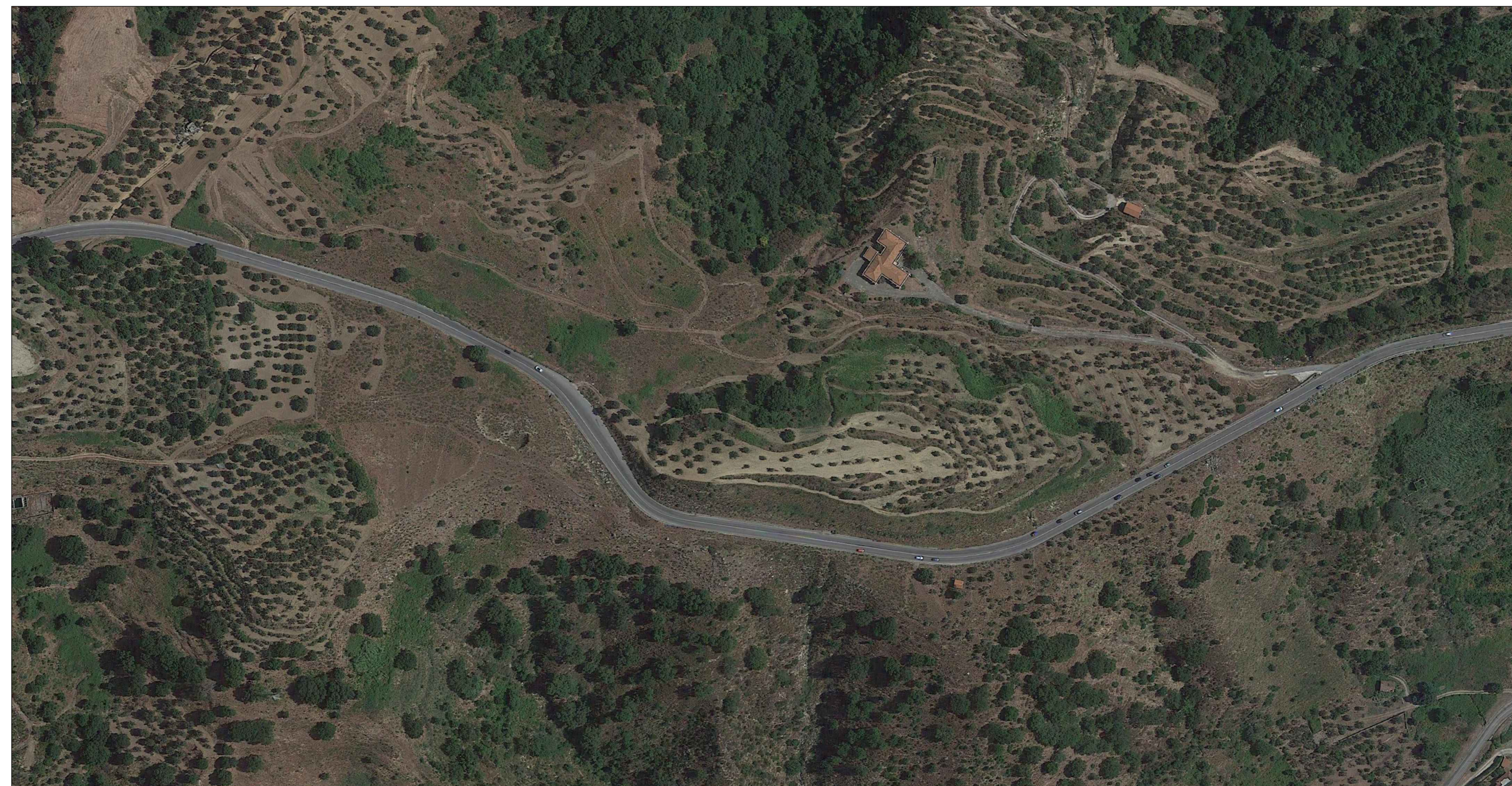
Simulazione su foto aerea - Galleria artificiale GA01 - Ante operam