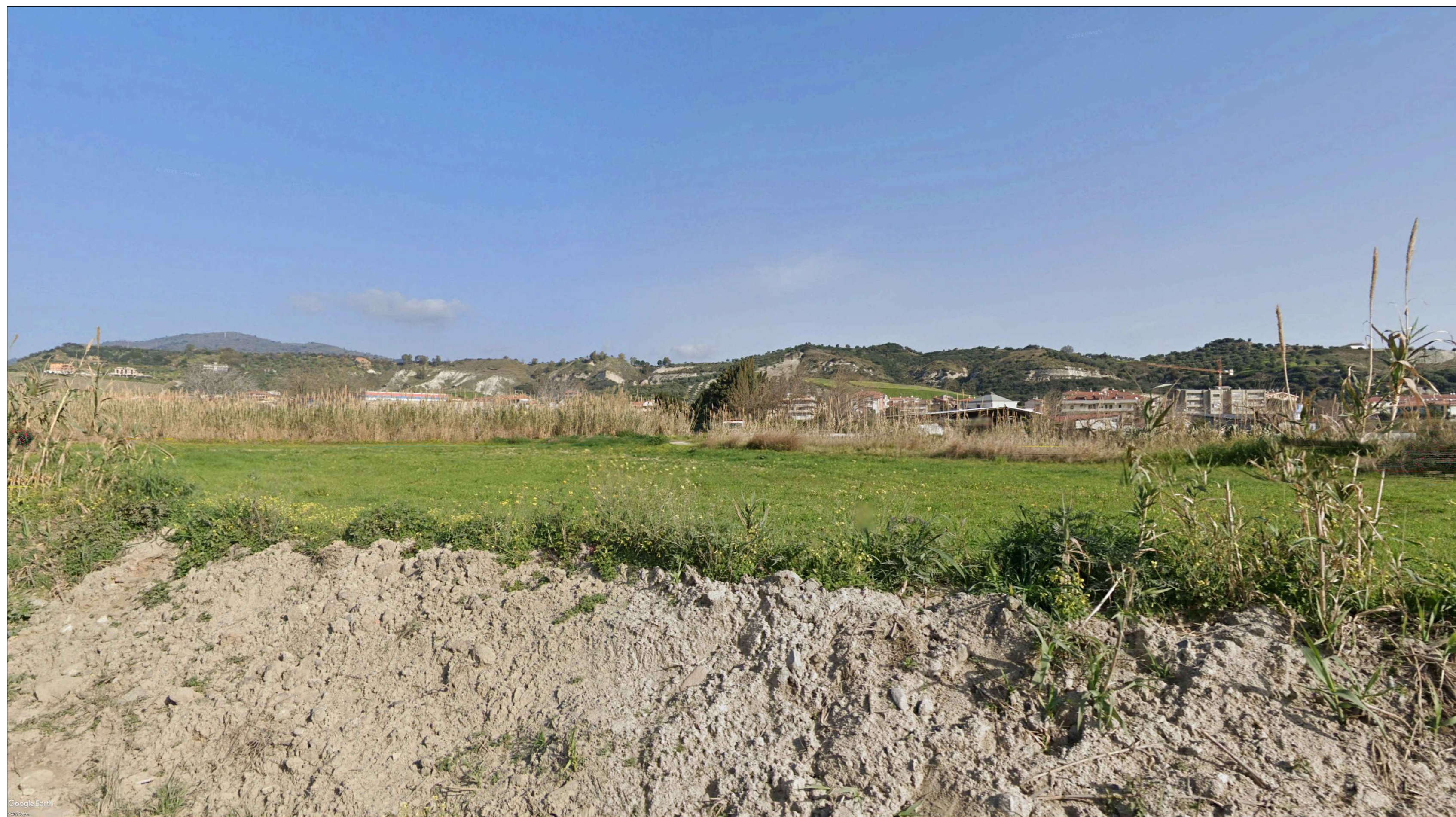
Viadotto VI01 - Vista 3 - Ante operam