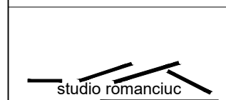
TAVOLA PROGETTO: 4.5.9