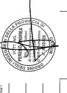
Fig.: INTM10D26P7GSD0000598.DWG n. Elab.: