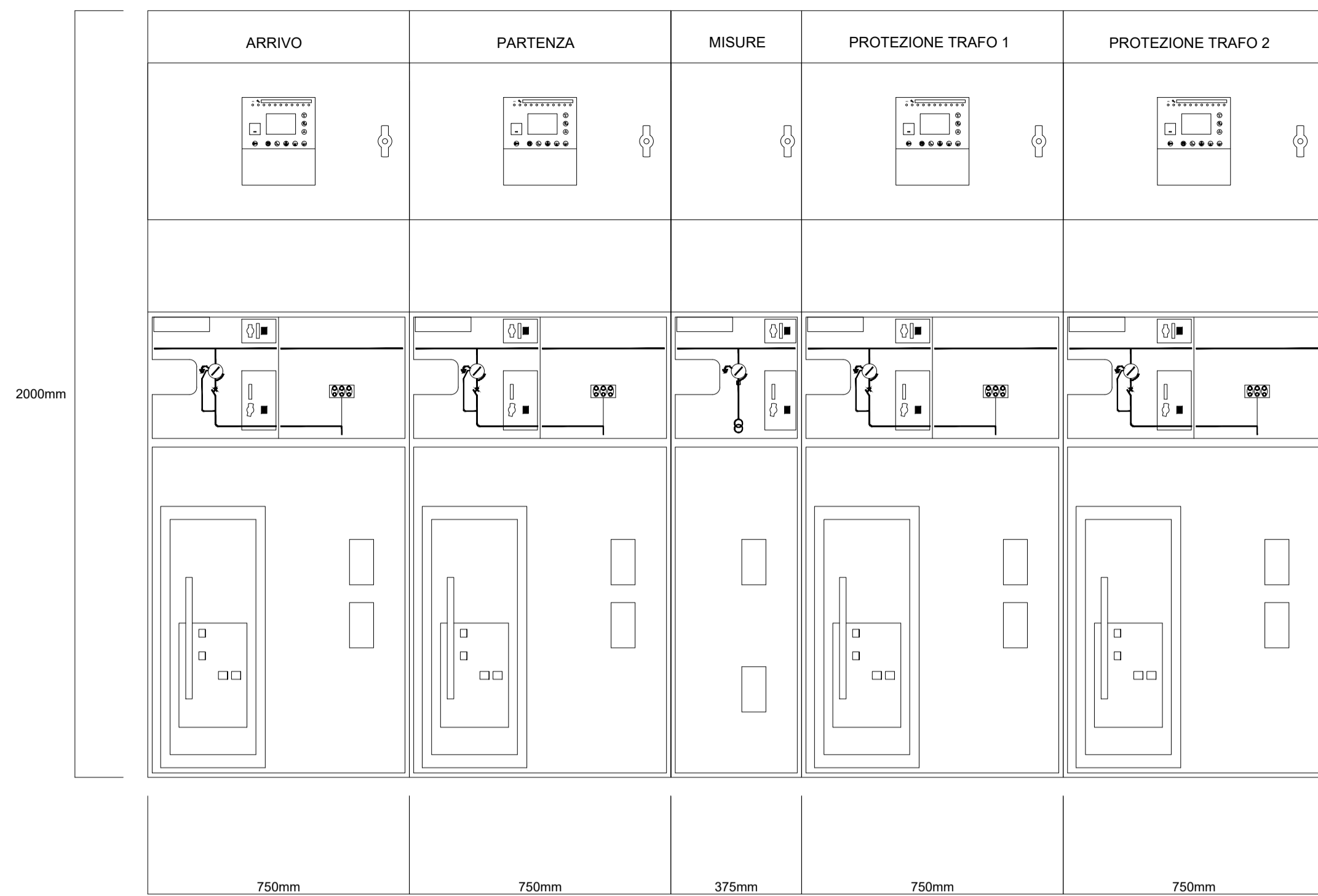
QMT - FRONTE QUADRO