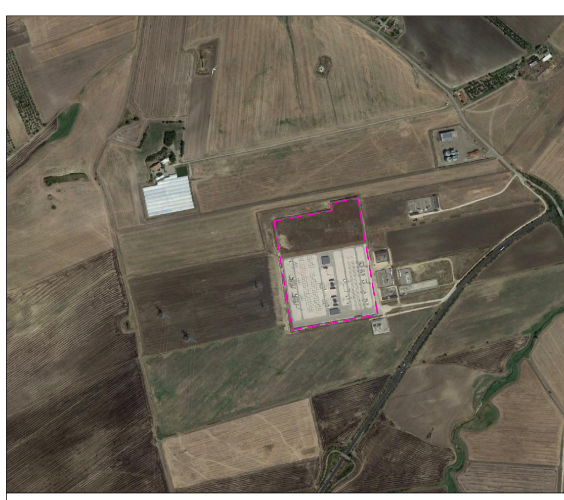
Ortofoto SE Terna "Melfi"