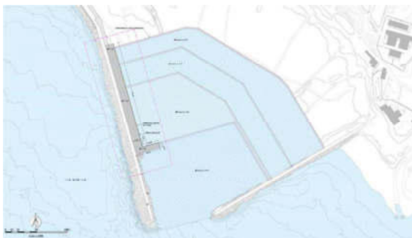
Figura 2 – Nuova banchina a seguito dei lavori di dragaggio

variabile, compresa tra 13,50 e 14,15 m. Tale banchina, in riscontro allo stato attuale di completo interrimento del porto, è stata ideata con una soluzione costruttiva che prevede la realizzazione da terra del muro di sponda e il completamento della sovrastruttura di banchina, in modo che diventi operativa a seguito dei lavori di dragaggio previsti nel progetto di “ripascimento artificiale del litorale in erosione della frazione marina di Eraclea Minoa”.