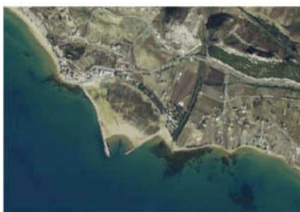
Ortofoto del porto di Siculiana al 2006