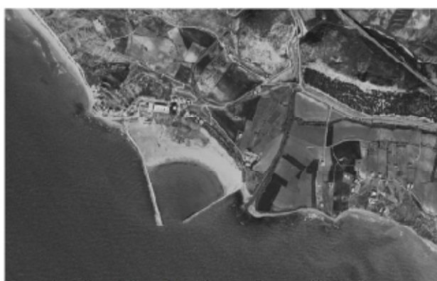
Ortofoto del porto di Siculiana al 1988

Il tratto di costa circostante il porto è piuttosto attivo dal punto di vista dell'evoluzione costiera e delle linee di riva. L'area interna al porto di Siculiana è caratterizzata dalla presenza di sedimenti accumulatisi al suo interno nel corso degli ultimi decenni, per mezzo del lento ma continuo apporto di materiale solido trasportato dalla corrente che costeggia tutto il litorale, sedimenti che hanno ormai interrato la quasi totalità dell'ex specchio acqueo.