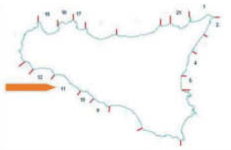
Figura 1 – Area di collocazione del progetto.

L'area oggetto del presente lavoro ricade nella tavoletta Siculiana dell'I.G.M., foglio n°266 della carta d'Italia, II quadrante NE. Essa si colloca nella fascia antistante il Canale di Sicilia, prospiciente l'abitato della frazione marinara del Comune di Siculiana (Siculiana Marina), nel tratto di costa ricompreso all'interno dell'Unità Fisiografica n. 11. Tale area si sviluppa da ovest verso est da Capo San Marco a Capo Rossello, per una lunghezza totale di Km 56,743 e ricade lungo il litorale meridionale dell'isola che si affaccia sul Canale di Sicilia. Complessivamente il litorale presenta per il 15% coste rocciose medio-alte e alte e per il 77% spiagge, costituite da ciottoli per 2249 mt (4%), sabbia per 19630 mt (35%) e sabbia mista a ciottoli per 21.355 m (38%). Il rimanente 8% è costituito da litorale di natura artificiale, coincidente per lo più con aree portuali.