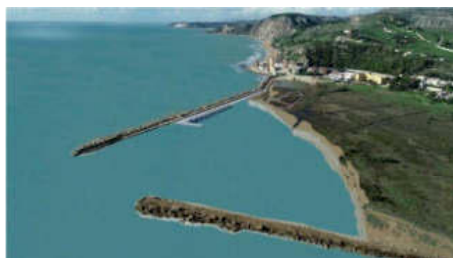
Figura 4 – Nuova banchina prima e dopo il prelievo dei sedimenti

Le attività verranno realizzate direttamente da terra e prevedono lo scavo di un tratto di diaframma di 2,80 m con spessore di 60 cm, per mezzo di benna mordente, iniezione di fango bentonitico allo scopo di sostenere lo scavo partire dalla profondità di 0,5/1 m circa, separazione del