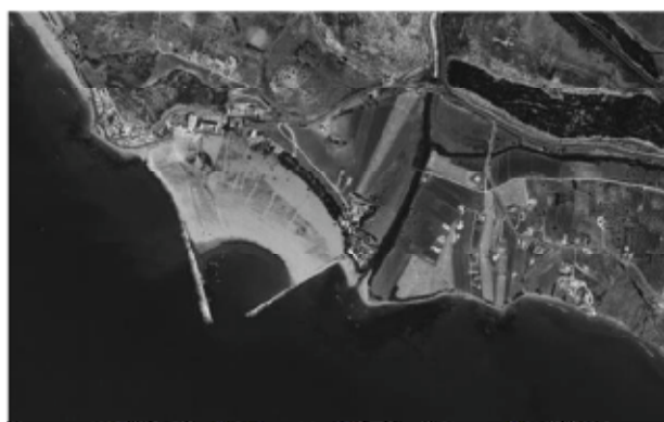
Ortofoto del porto di Siculiana al 1994