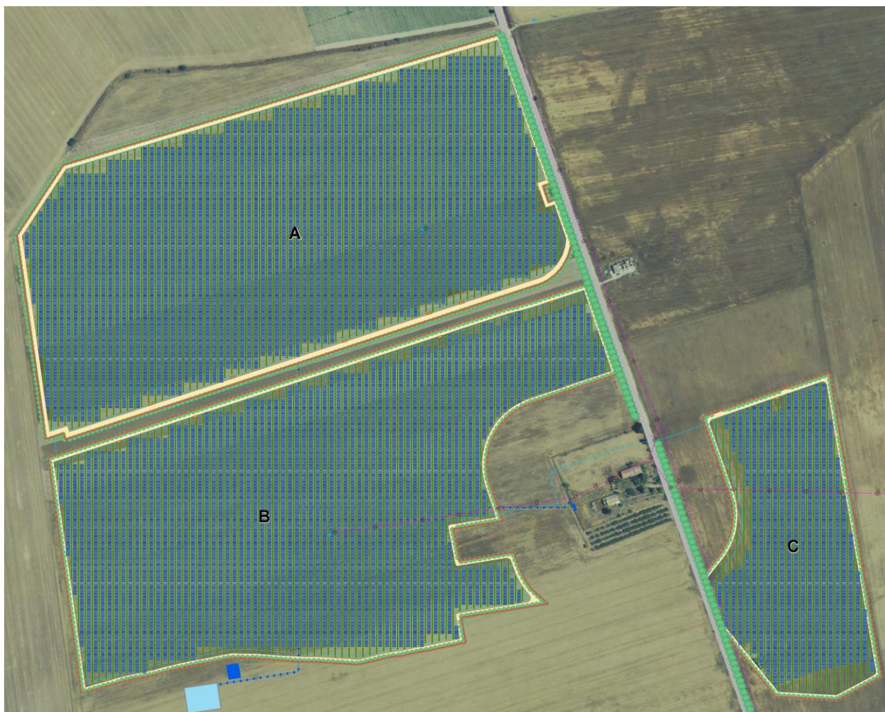
Fig. 1. Inquadramento territoriale dell'impianto.

La società proponente dell'impianto dispone delle aree di pertinenza in forza di atti preliminari stipulati che le rispettive proprietà hanno sottoscritto.