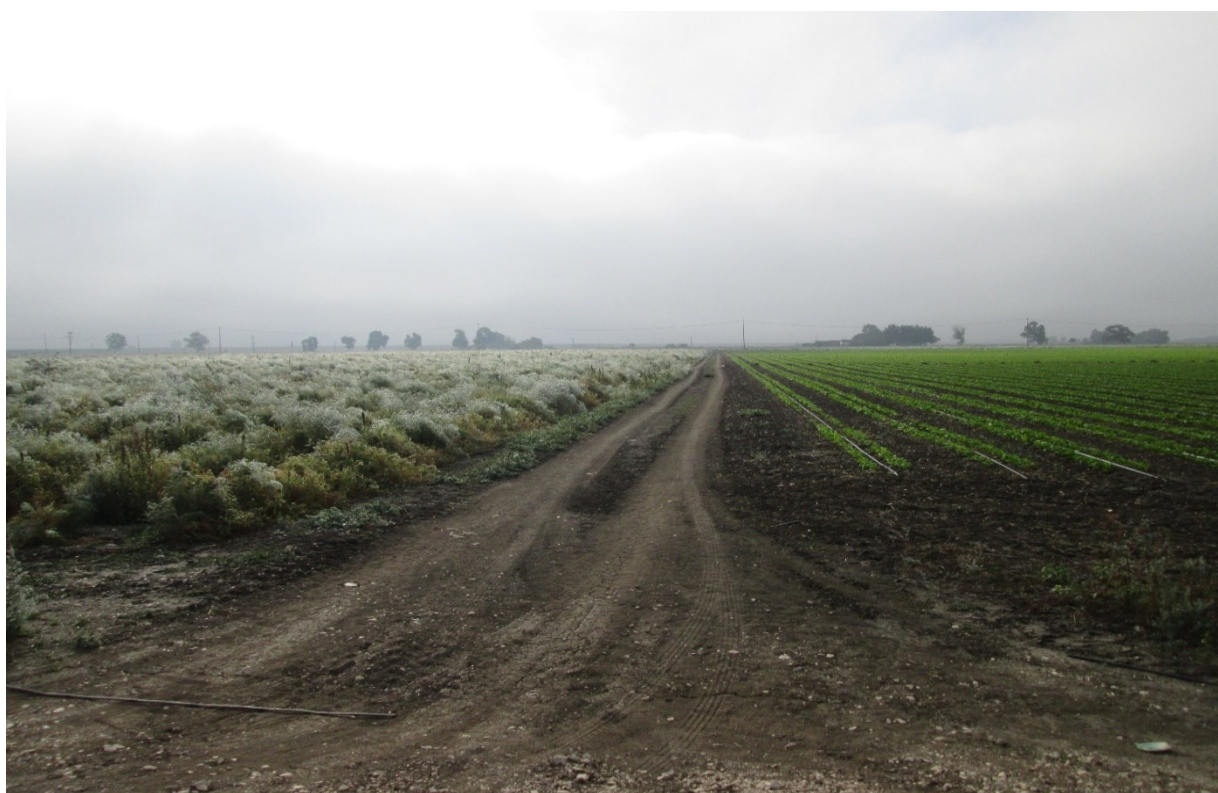
Figura nn 3 - 4 - 5 - 6: Visuale panoramica del fondo agricolo