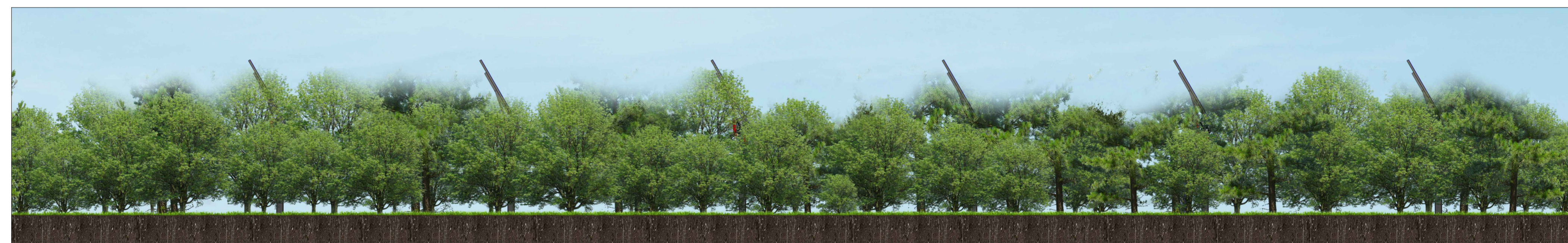
FOTO STATO DEI LUOGHI