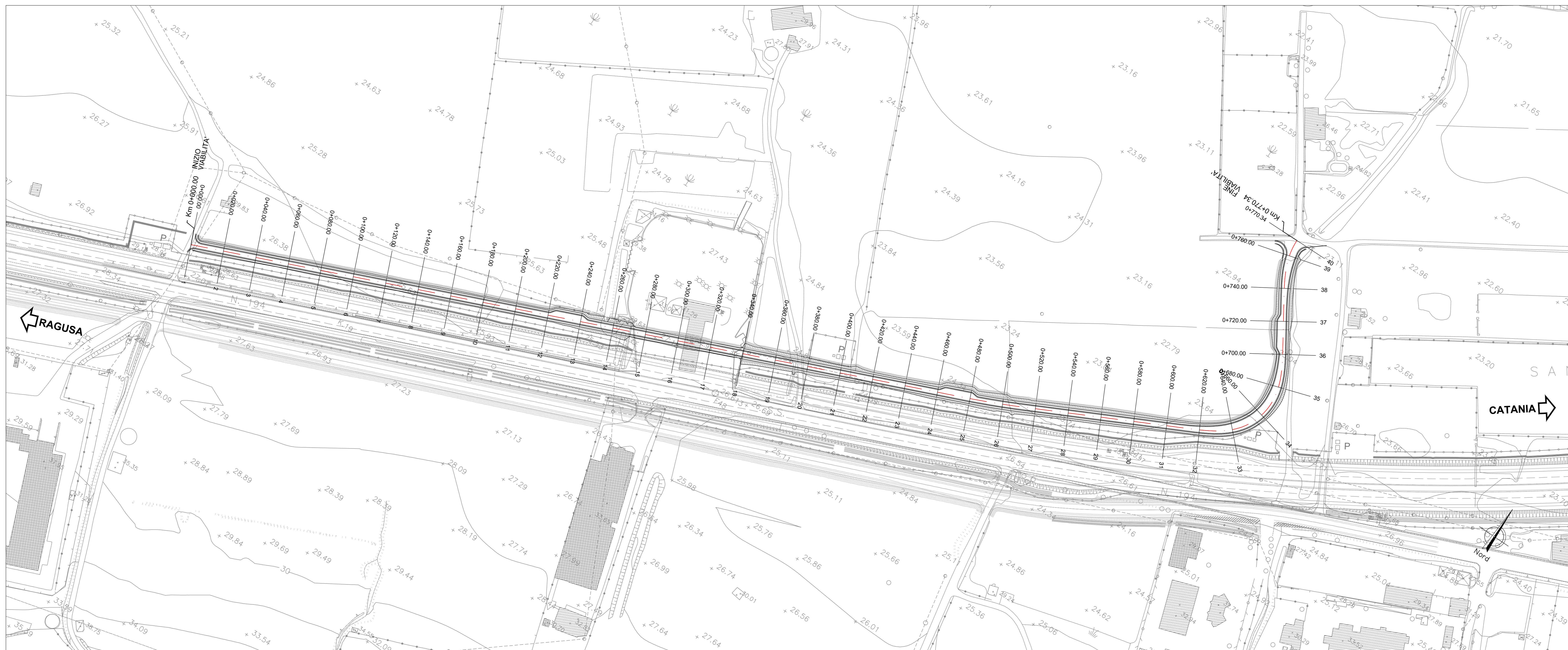
PLANIMETRIA DI INQUADRAMENTO - Scala 1:1000