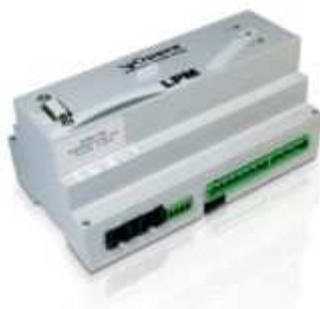
Vista regolatore di flusso luminoso

Il regolatore dialogherà con ogni singolo punto luce tramite un dispositivo installato su ogni corpo illuminante che, in modalità wireless, consentirà la gestione ed il comando di tutti gli impianti previsti nel presente intervento.