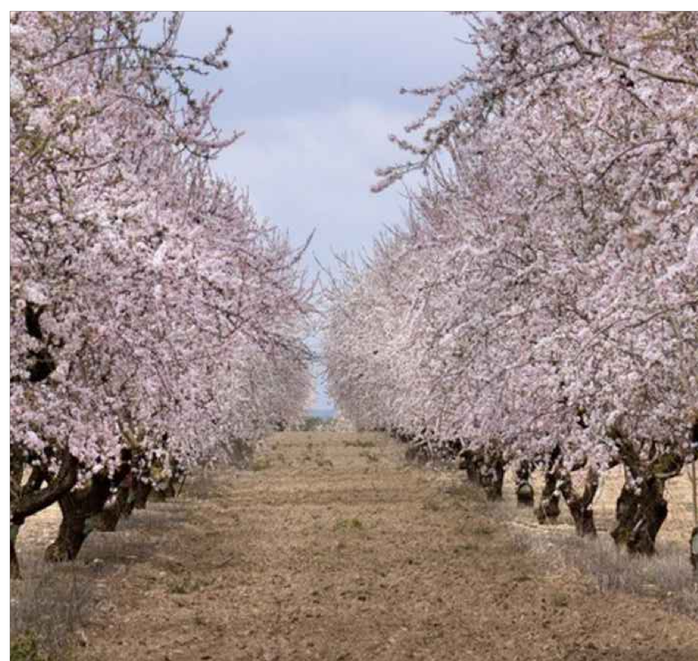
TIPOLOGIA PIANTE COLTIVABILI PER LA MITIGAZIONE ESTERNA IN LOCALITA' MARINEO - MANDORLO