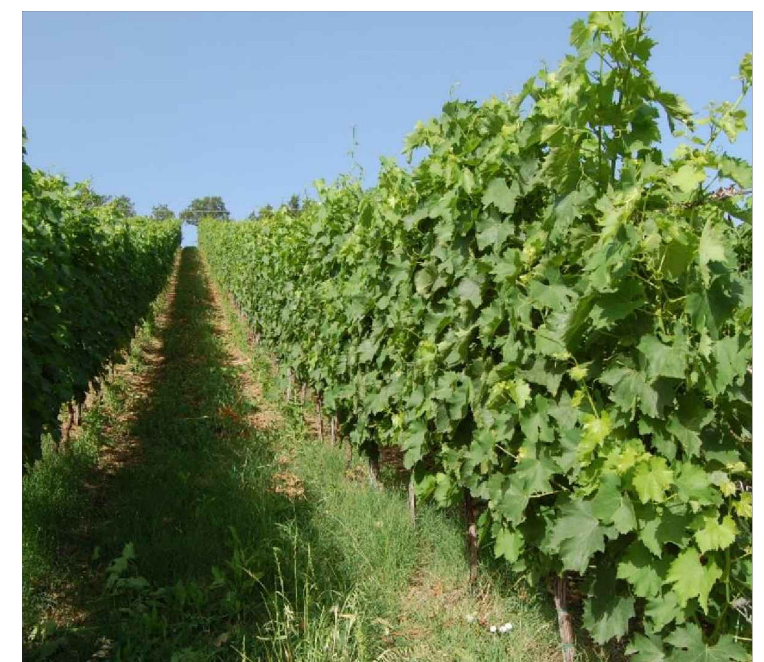
TIPOLOGIA PIANTE COLTIVABILI SOTTO I PANNELLI FOTOVOLTAICI IN LOCALITA' MARINEO - VITE