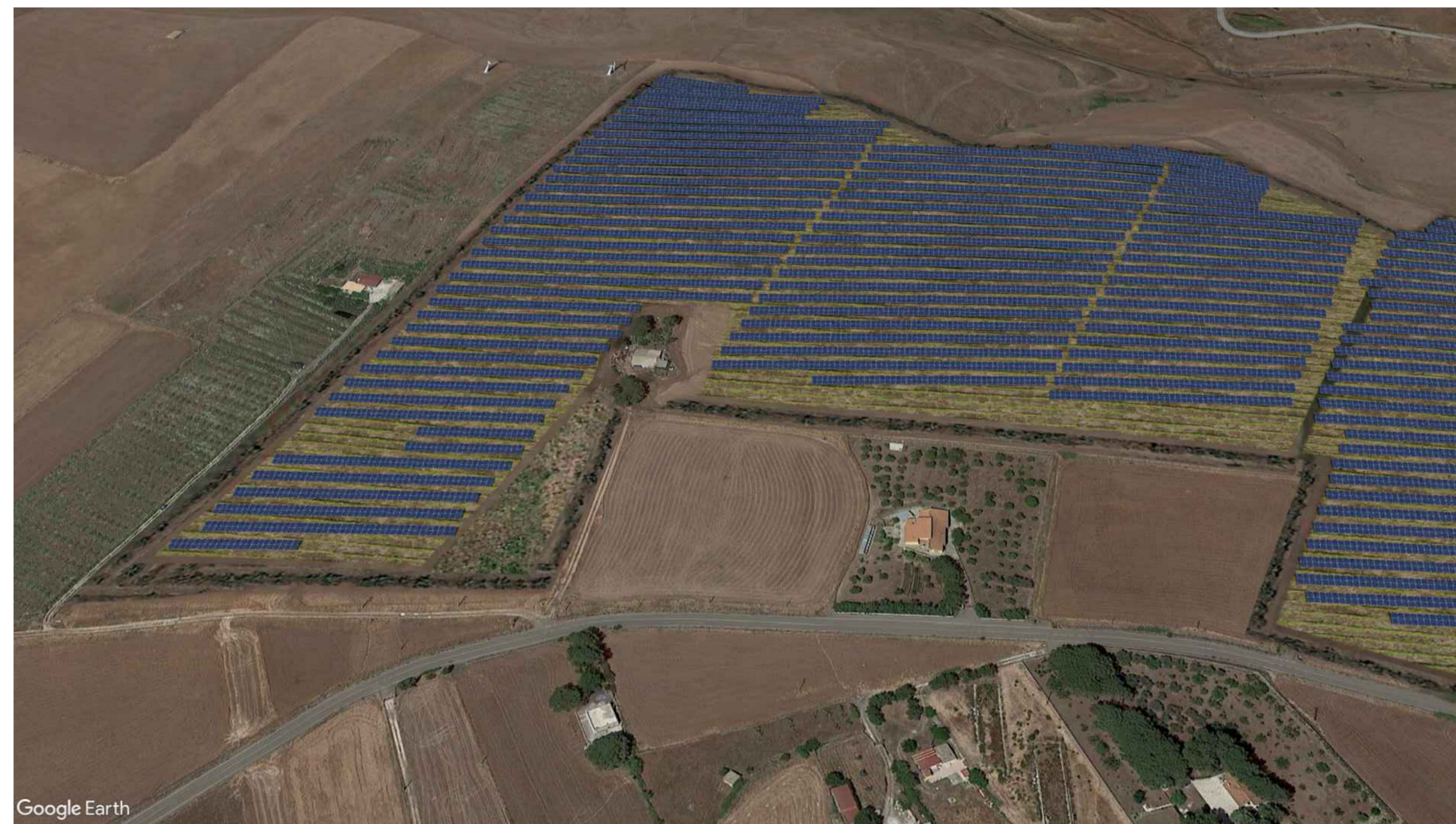
Parziale dell'Area Nord-Ovest - ex post