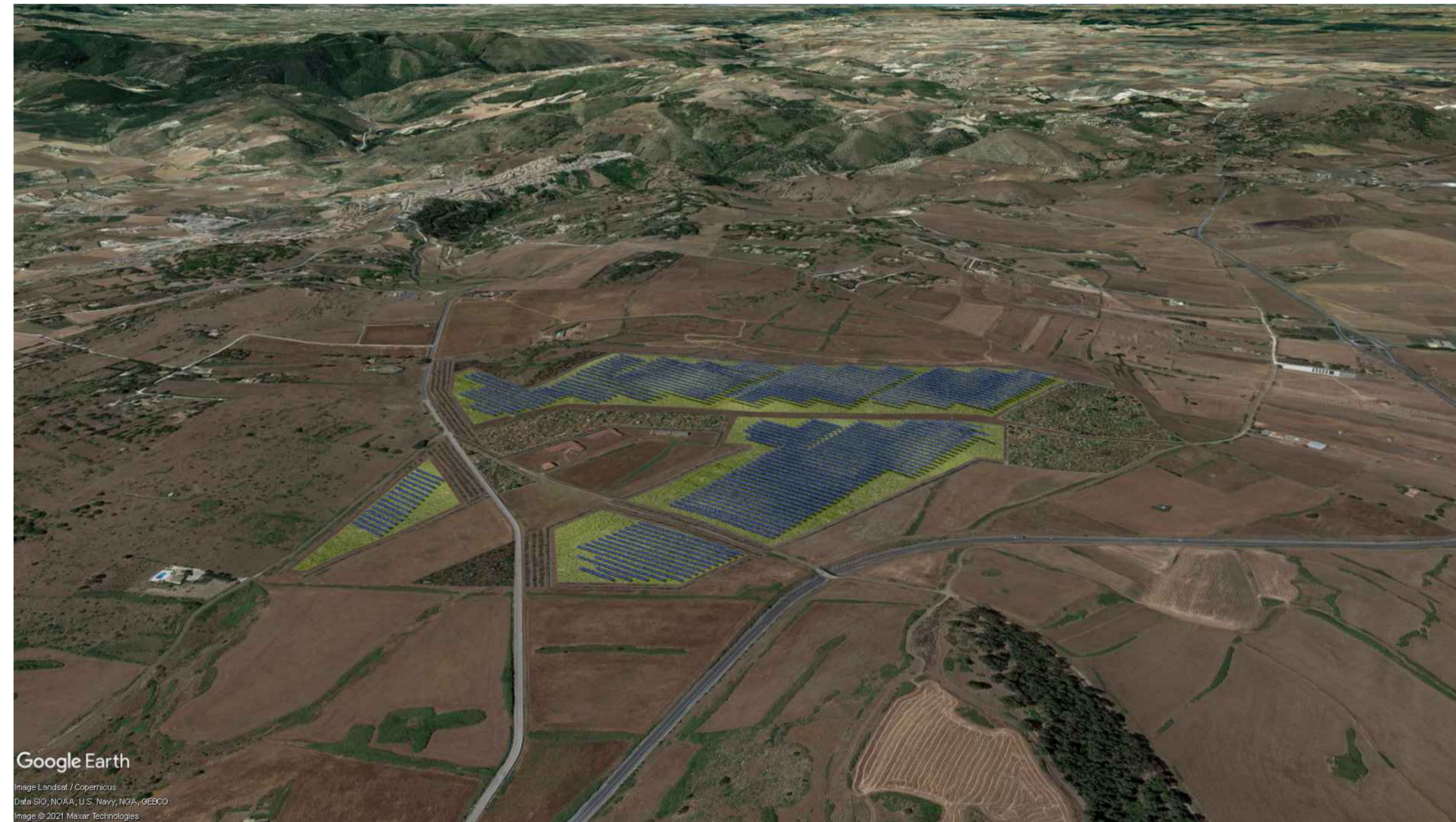
Area Sud - ex post