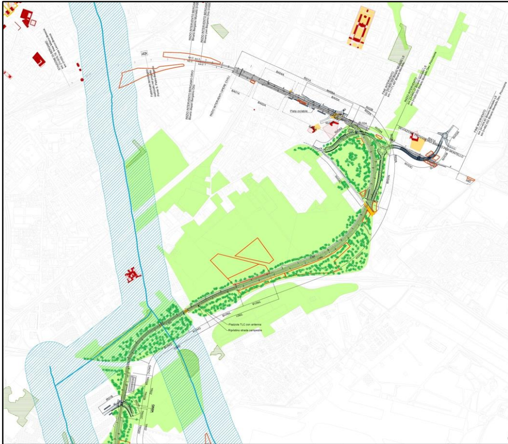
Estratto Tavola di progetto con inserimento del bosco lineare