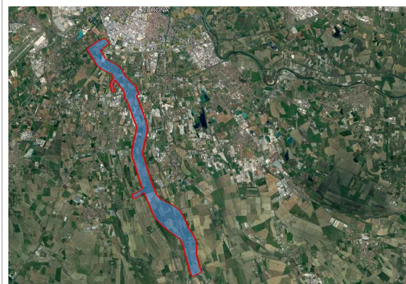
Tavola: TAV.06.07 ORTOFOTO Scala: 1:2.000 Data: Ottobre 2020 Prof. documento:

OGGETTO: RILIEVI TOPOGRAFICI S.S. 12 "Dell'Abetone e del Brennero" Variante Verona Sud - Isola della Scala