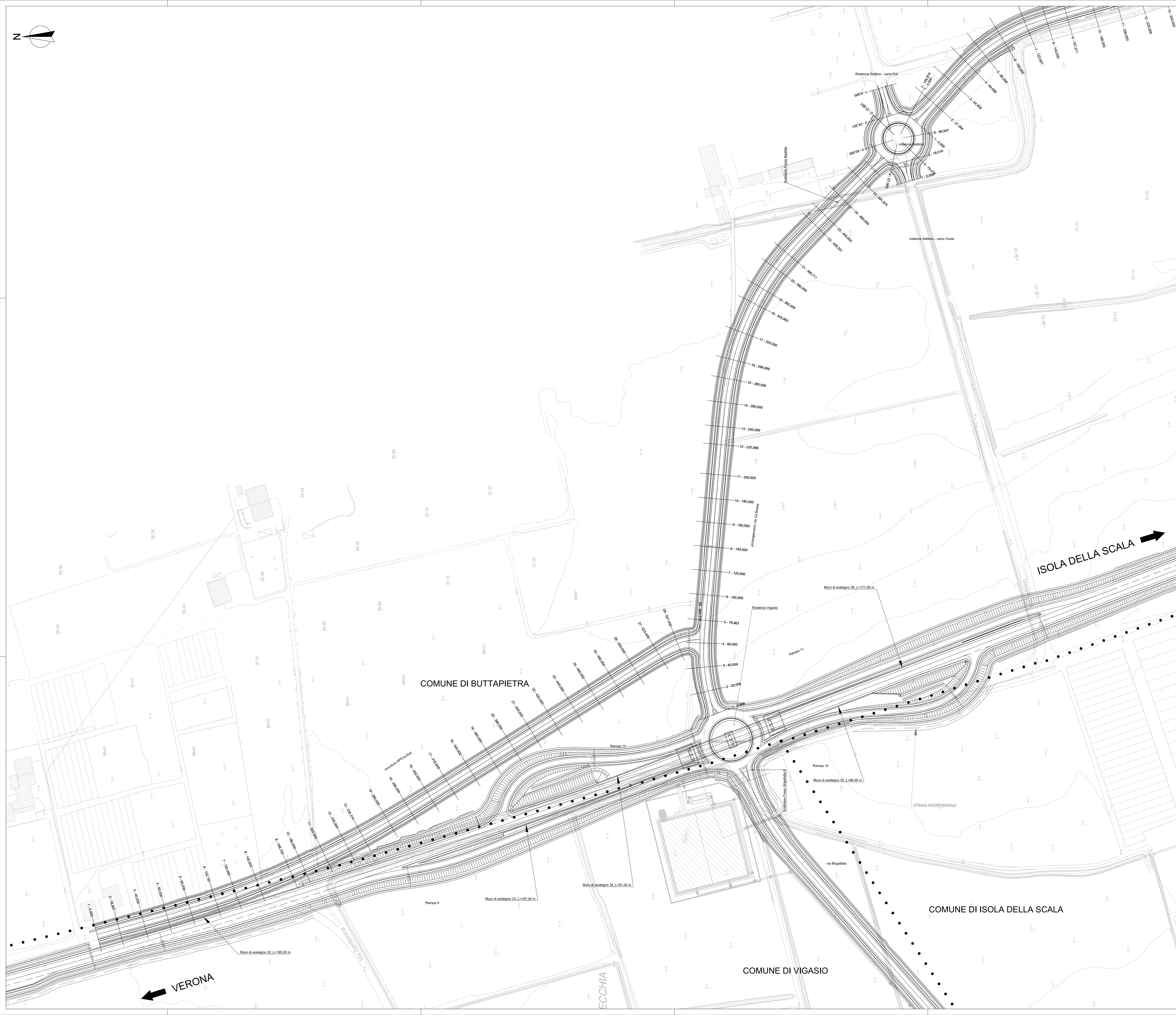
Quadro d'unione - scala 1:50.000