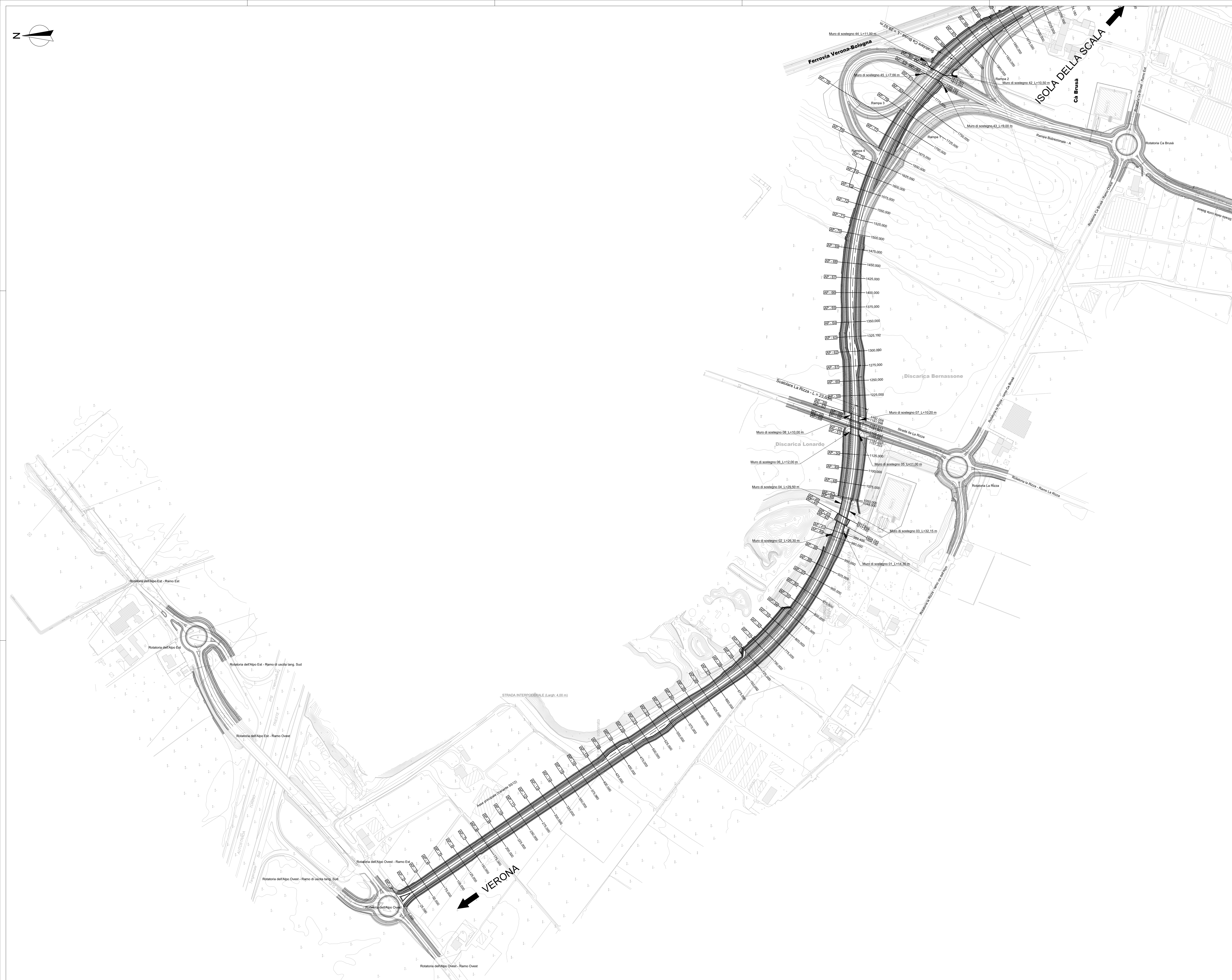
Quadro d'unione - scala 1:50.000