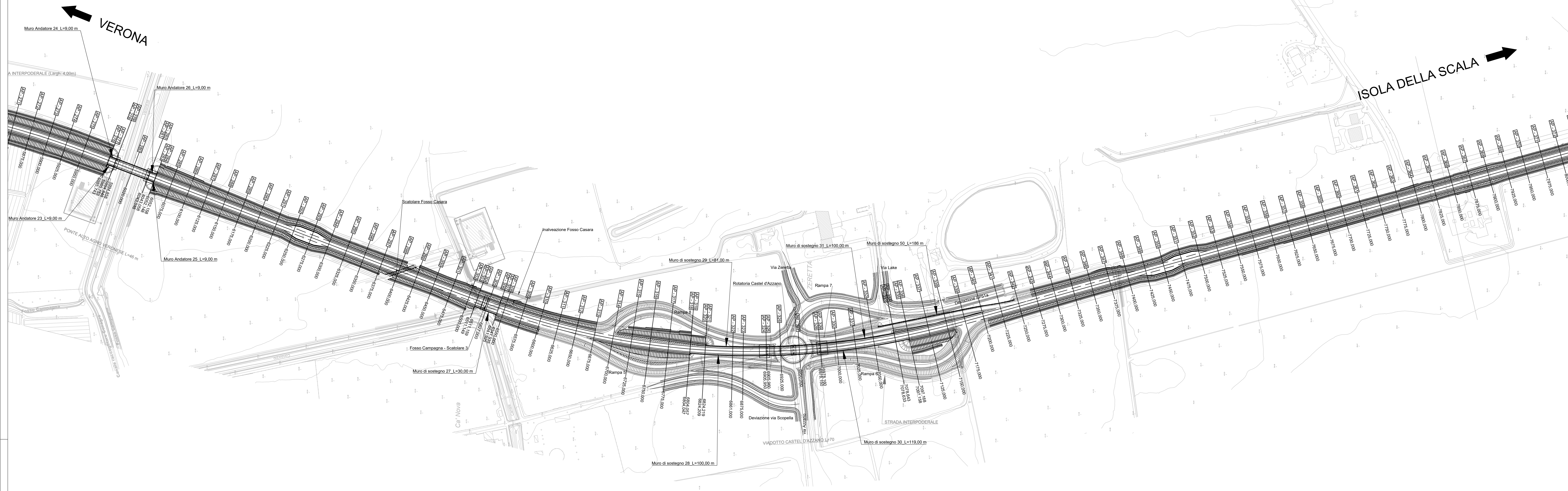
Quadro d'unione - scala 1:50.000