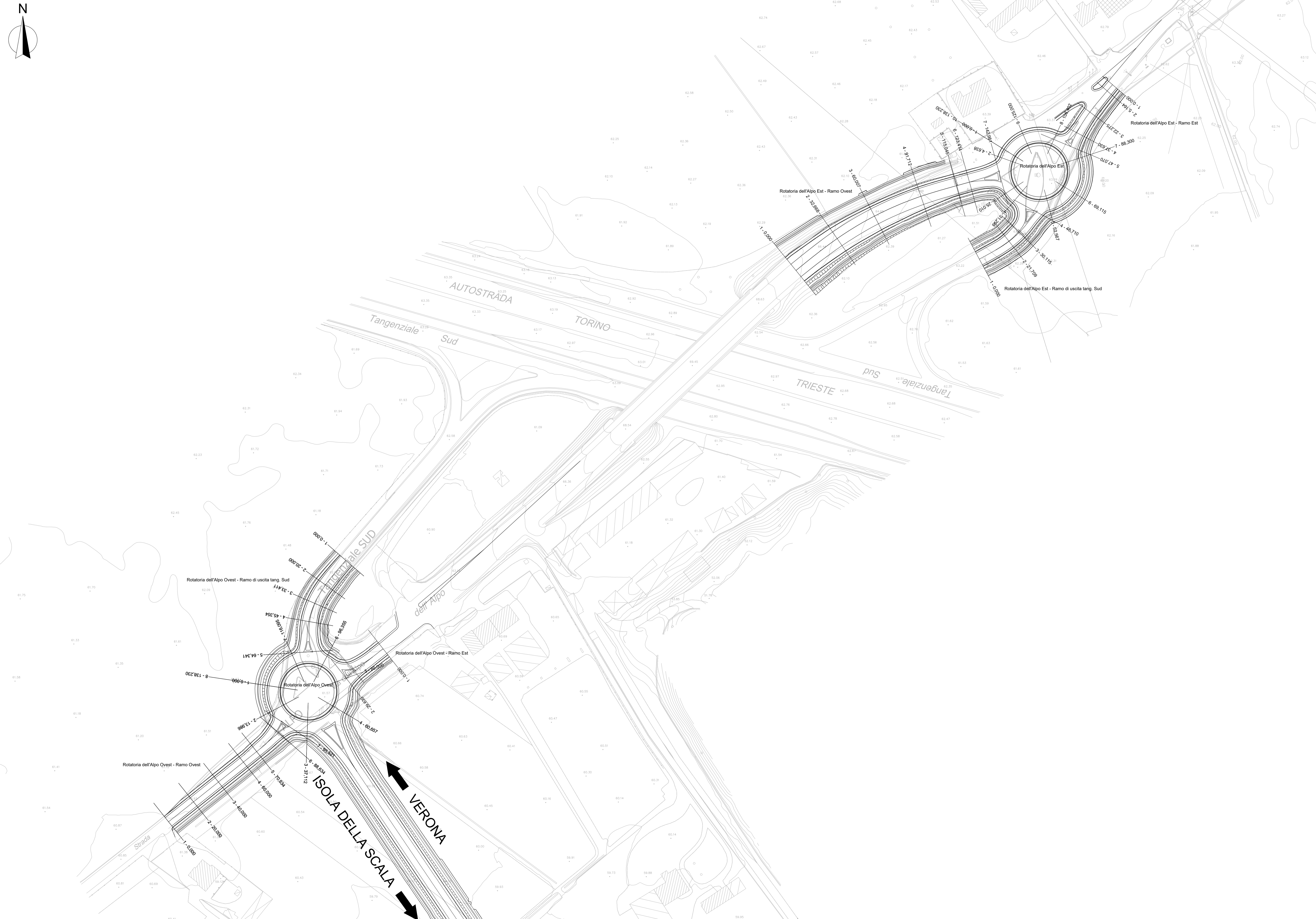
Quadro d'unione - scala 1:50.000