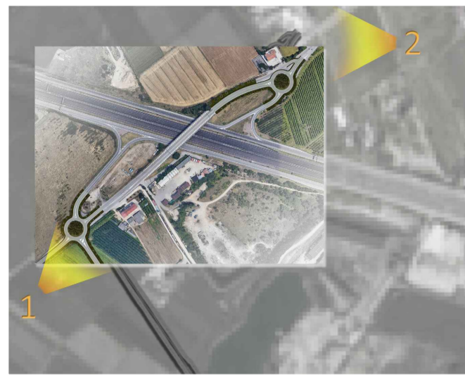
1 - stato di fatto