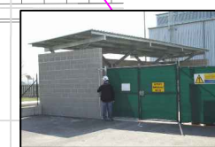
42:DT1 PORZIONE COPERTA