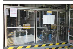
41:INTERNO IMPIANTO DEMI (SERBATOI)