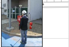
23:CONTAINER STOCC AMMONIACA