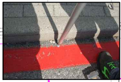
33:ENTRATA LABORATORIO CHIMICO