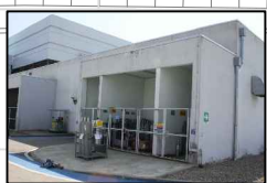
32:MAGAZZINO OLI NUOVI /DT3 OLI ESAUSTI