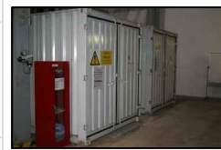
34-35:CONTAINER TRISODIOFOSFATO 1E2