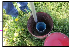
29:PIEZOMETRO PER POZZO PROFONDO