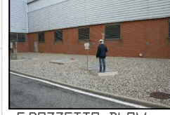
5:POZZETTO BLOW DOWN