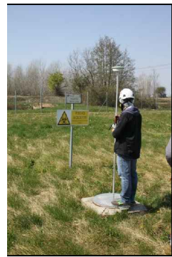
6:POZZETTO REFLUI CIVILI