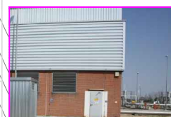
26:SPIGOLO ESTERNO FABBRICATO