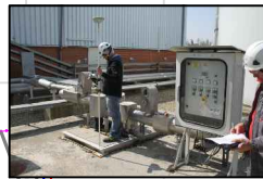
19:PRESA POZZO SUPERFICIALE