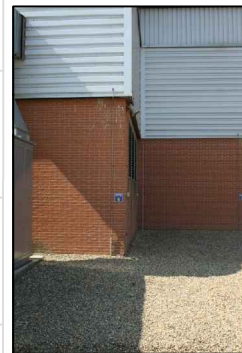
27:ESTERNO CENTRALE TURBINE