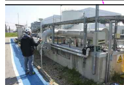
8:SCARICO DA VASCA UGU