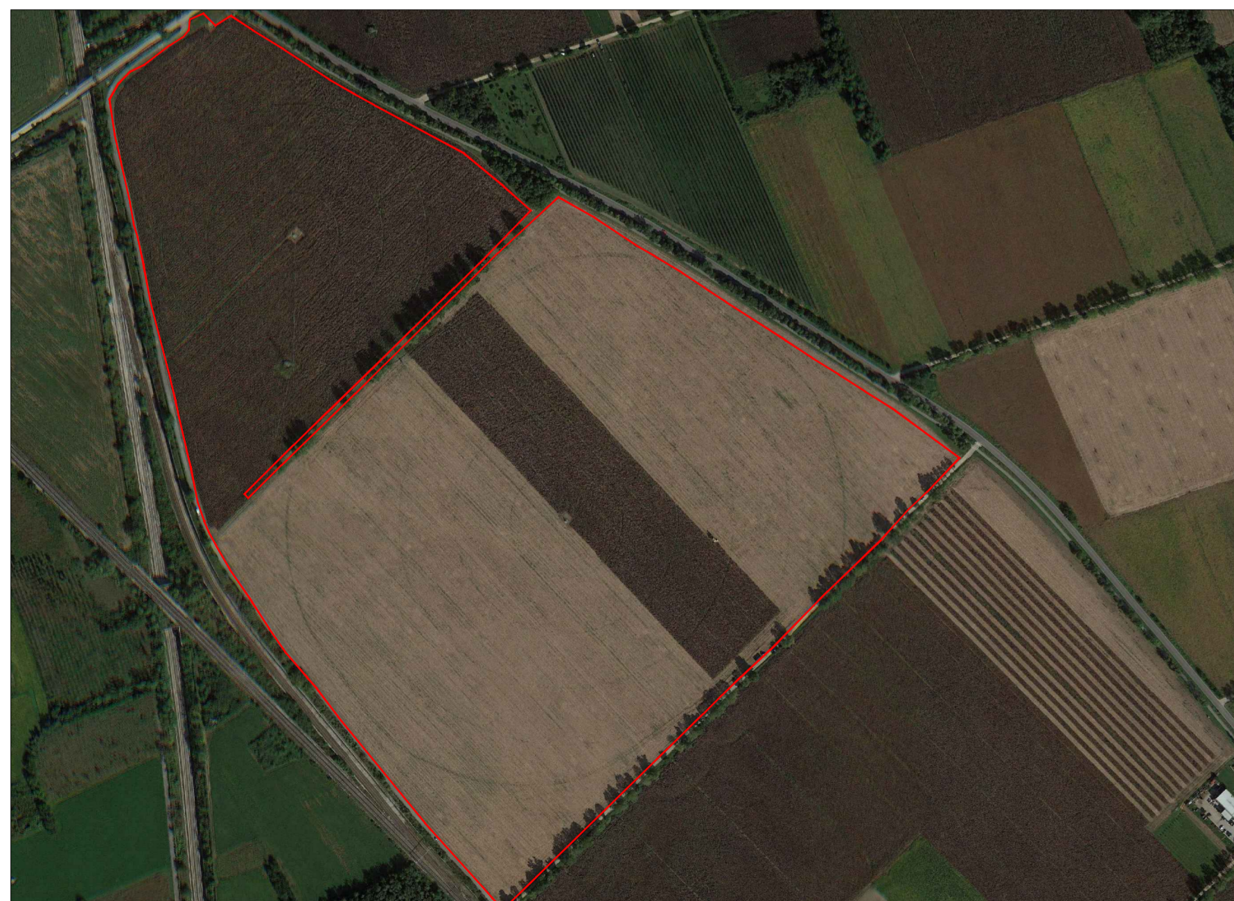
ORTOFOTO - Scala 1:5000