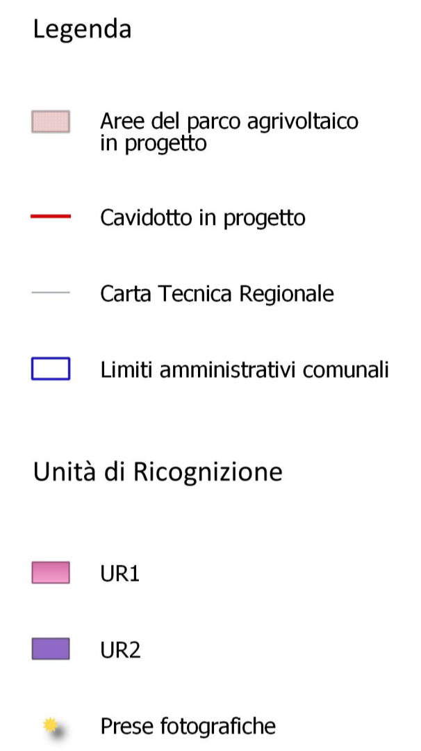
Tavola 3A Unità di Ricognizione e punti di presa fotografica Base cartografica: Carta Tecnica Regionale Numerica Friuli Venezia Giulia in formato .shp Scala 1:20000 Unione elementi 066120, 066160, 087040, 087080, 088010, 088050 File di riferimento: TVU21SOL1.qgz

Documento redatto da: dott. M. CALOSI Via S. Osvaldo n. 36 33100 - Udine (UD) CLSMSM80H24F356N P. IVA 02921870305