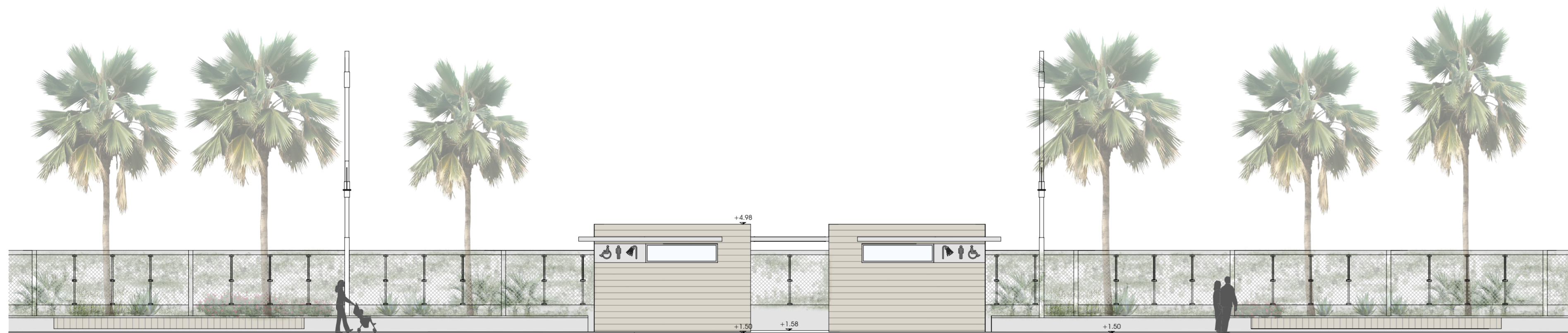
Prospetto sud scala 1:100