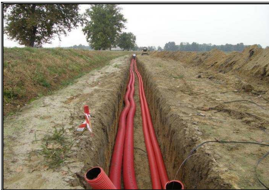
figura n. 7 – Alcune fasi relative per la costruzione dell’impianto