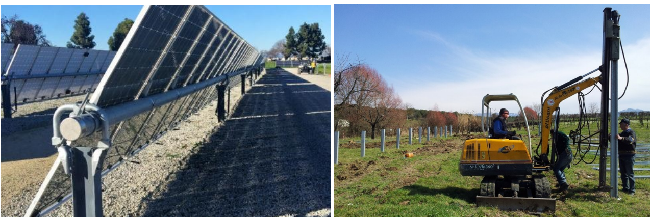
Figura 1 – Esempio di posa delle strutture portanti

I pannelli fotovoltaici saranno posizionati su uno scheletro di acciaio avente la base direttamente inserita nel terreno; non vi sarà quindi una piattaforma di cemento. Per la posa del basamento in acciaio si prevede l'utilizzo di un battipalo come indicato in Figura 3.