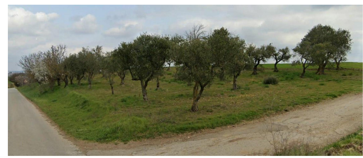
Figura 2: uliveti