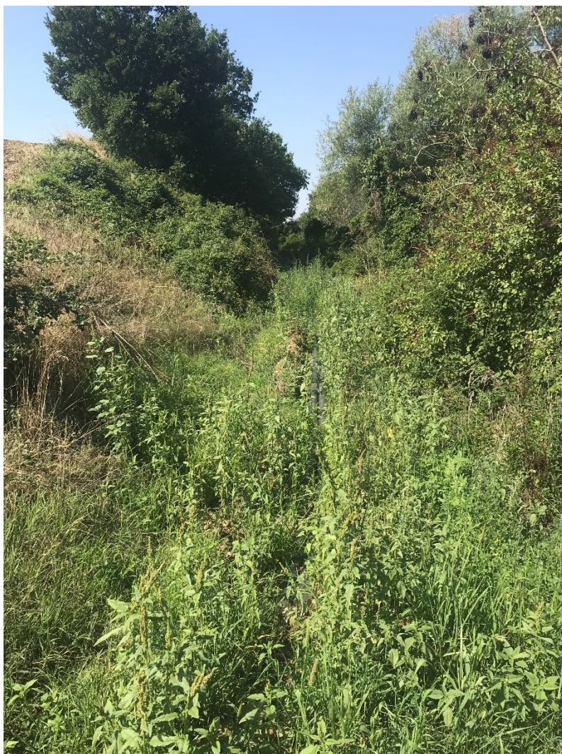
Inquadratura da valle tratto 1 – sezione 110 nel modello idraulico