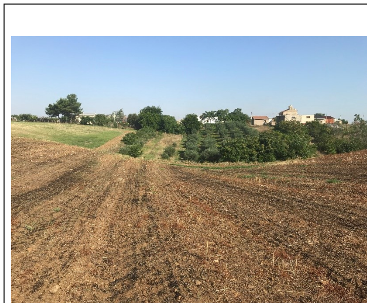
Immagine dell'avvallamento più significativo

Nella foto seguente, rilevata corso di un sopralluogo, viene mostrato il più significativo di tali avvallamenti ubicato sul lato Nord- Est dell'area di interesse.