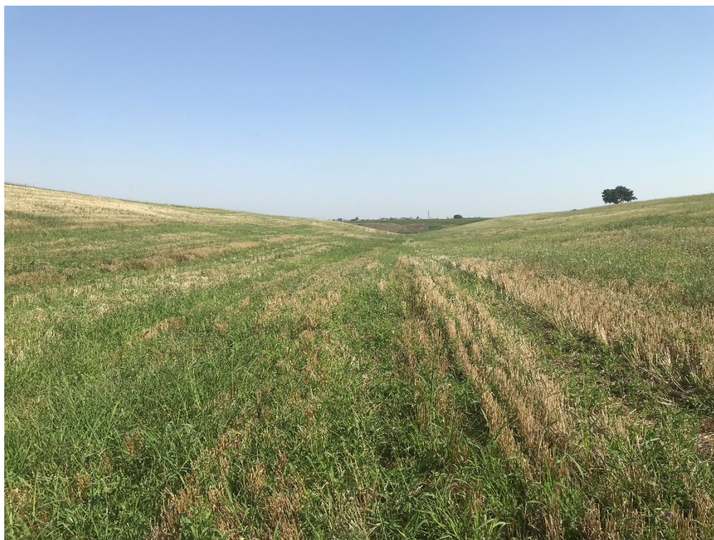
Inquadratura da valle tratto 2B – sezione 2230 nel modello idraulico