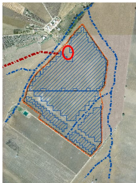
Ubicazione dell'avvallamento che interessa l'area della centrale fotovoltaica

In tale zona non è stata prevista l'installazione di moduli fotovoltaici anche per ragioni di esposizione sfavorevoli nei confronti dell'irraggiamento solare,.