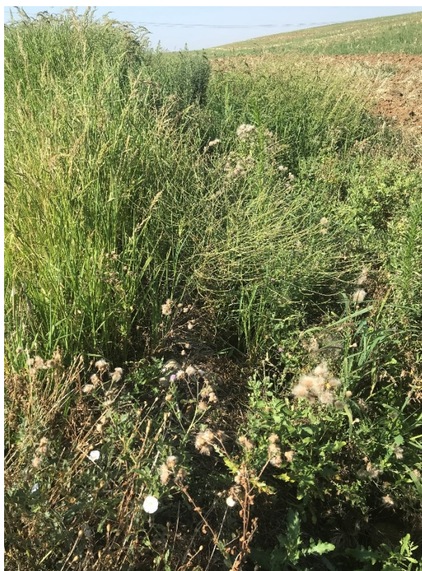
Inquadratura da valle tratto 1B – sezione 1230 nel modello idraulico