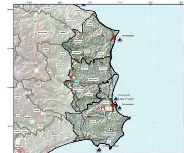
INFRASTRUTTURE E CULTURA Tav.3