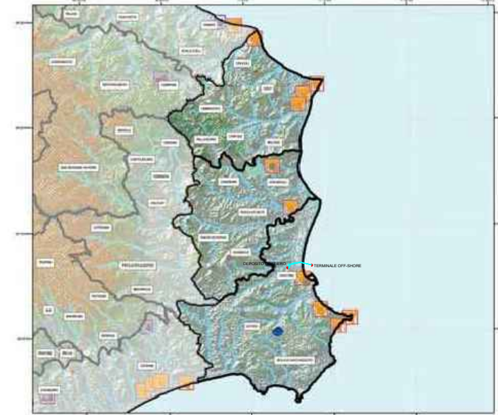
BENI CULTURALI e PAESAGGISTICI D.L. n°42/04 art. 134/136/142/143 Tav.5