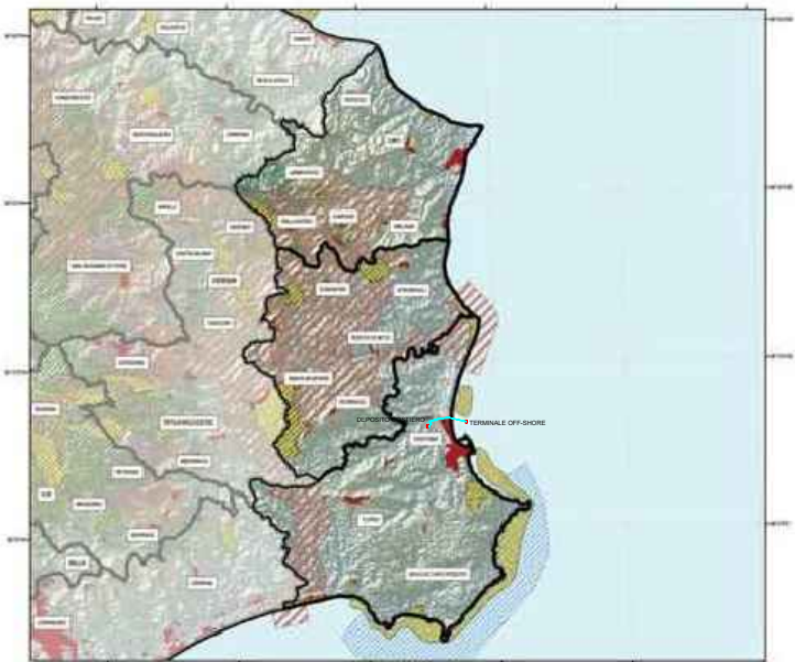
AREE PROTETTE E RETE NATURA Tav.4