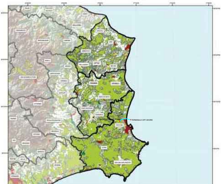
USO SUOLO Tav.2.2