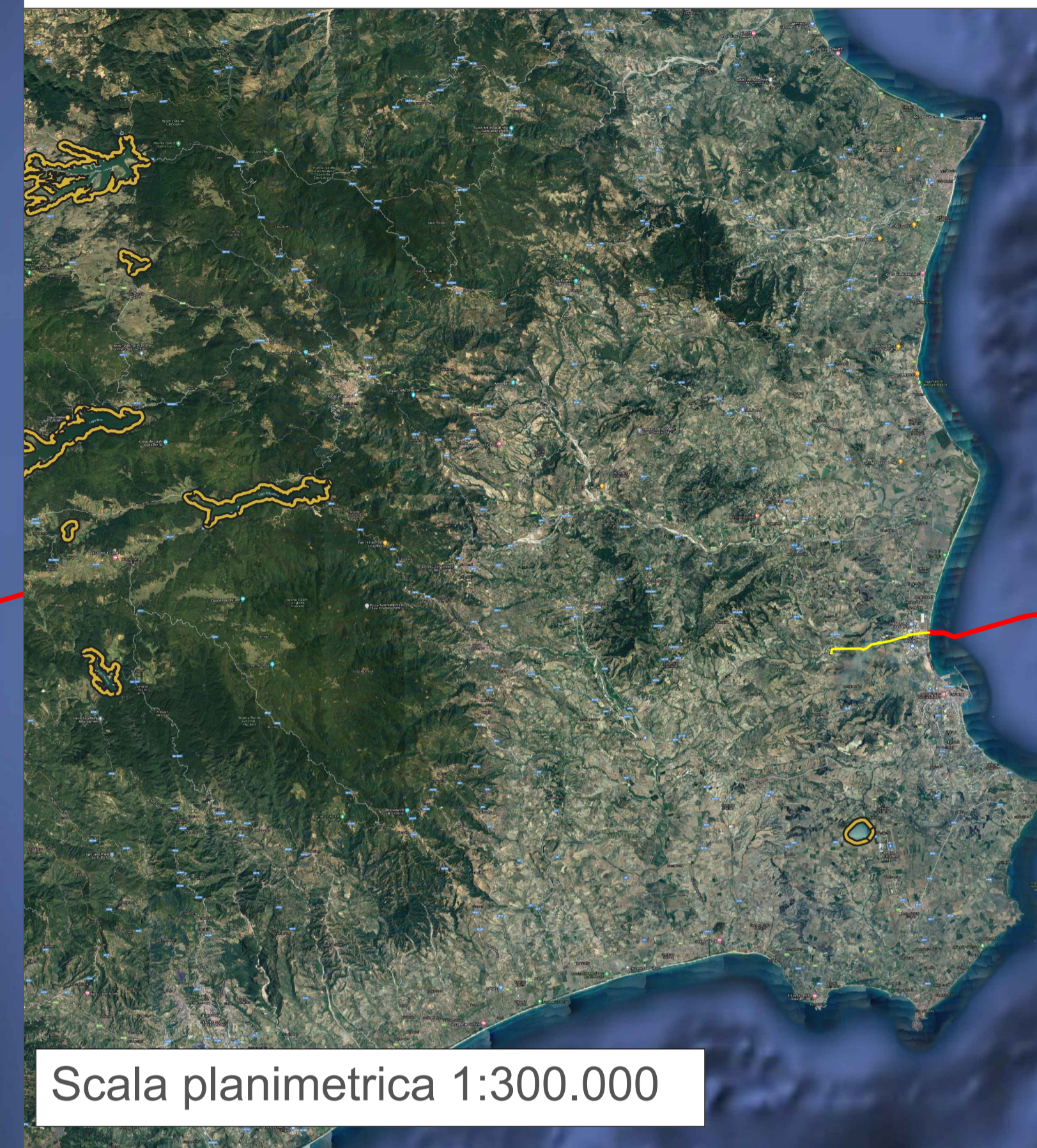
Scala planimetrica 1:300.000