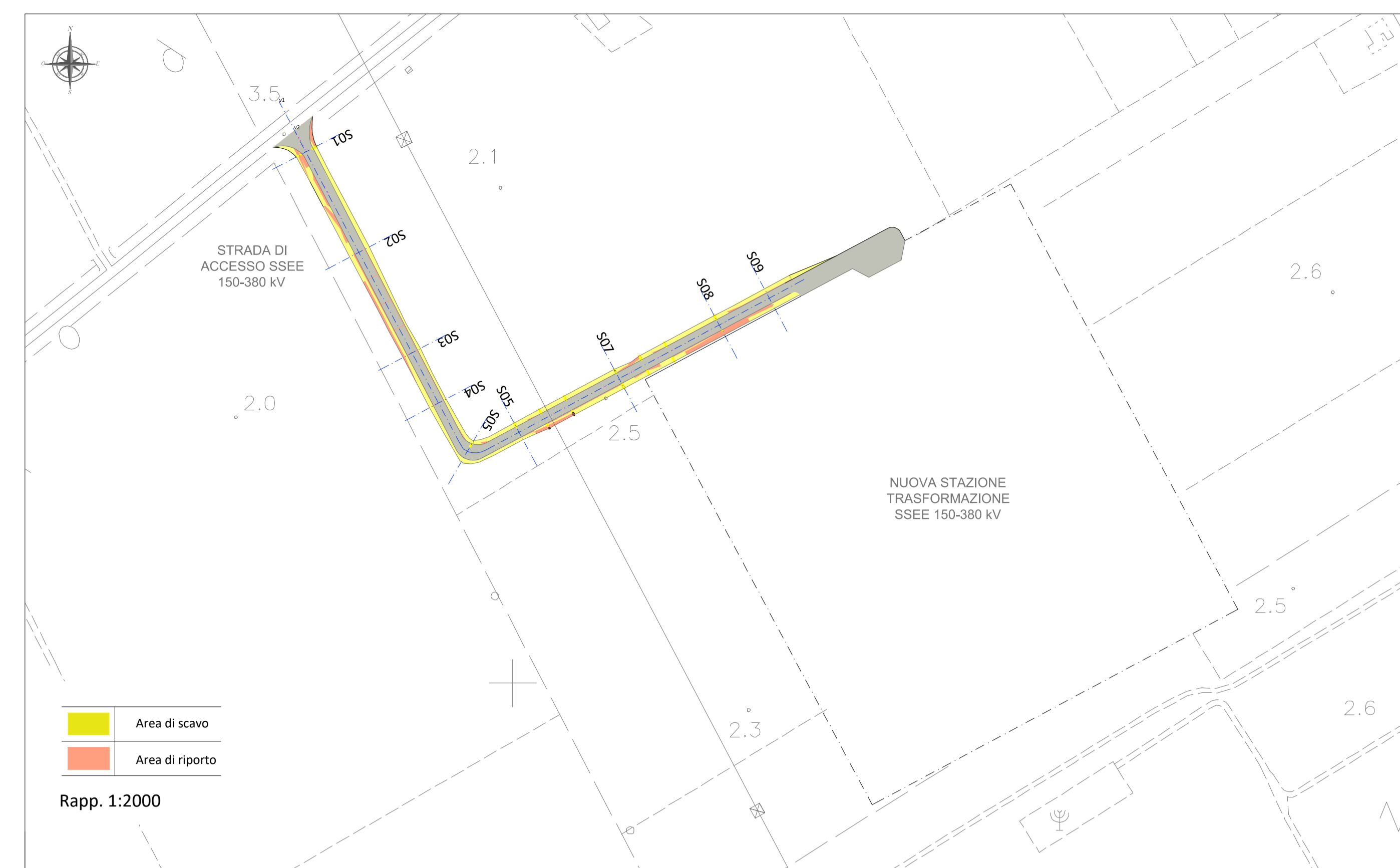
Stralcio planimetrico tratto stradale di accesso alla SSEE 150 - 380 kV - Cannello 380

S01 Area di Sterro: 0.00 Area di Riporto: 7.49 Altezza: 1.500 Lunghezza: 1.500