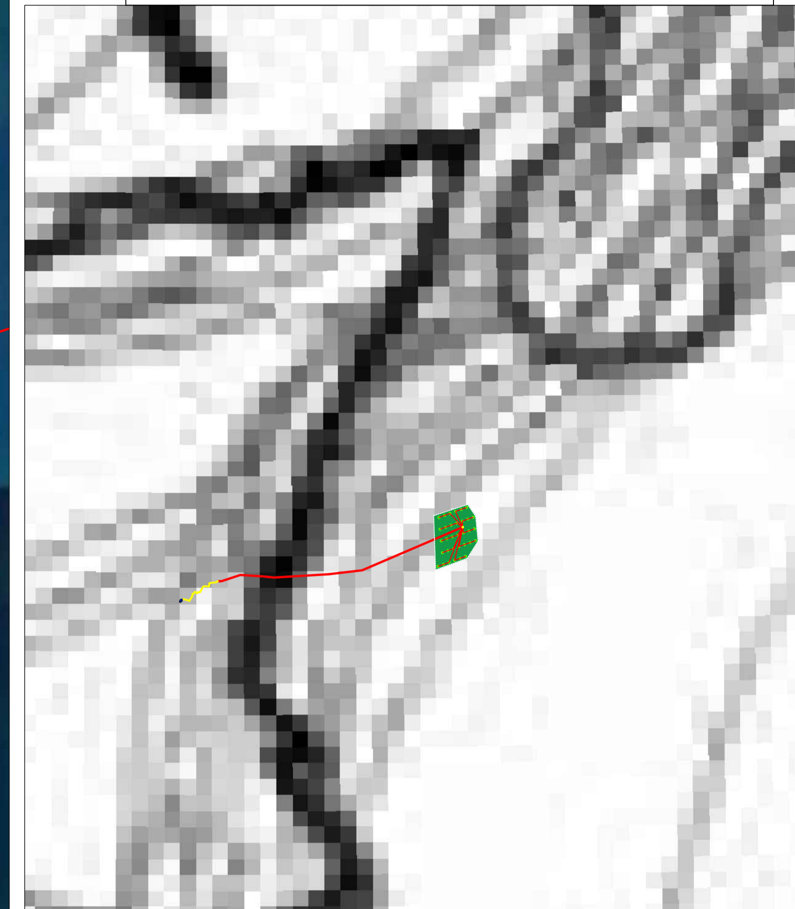
— PRINCIPALI ROTTE MIGRATORIE