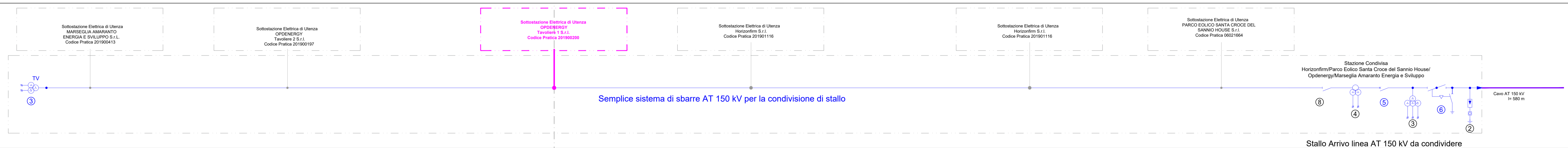
SEZ. A 0 -A 1 : profilo elettromeccanico longitudinale sbarre principali di condivisione (scala 1: 100)