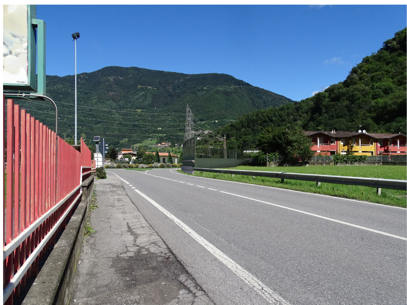
Stato di progetto con mitigazioni