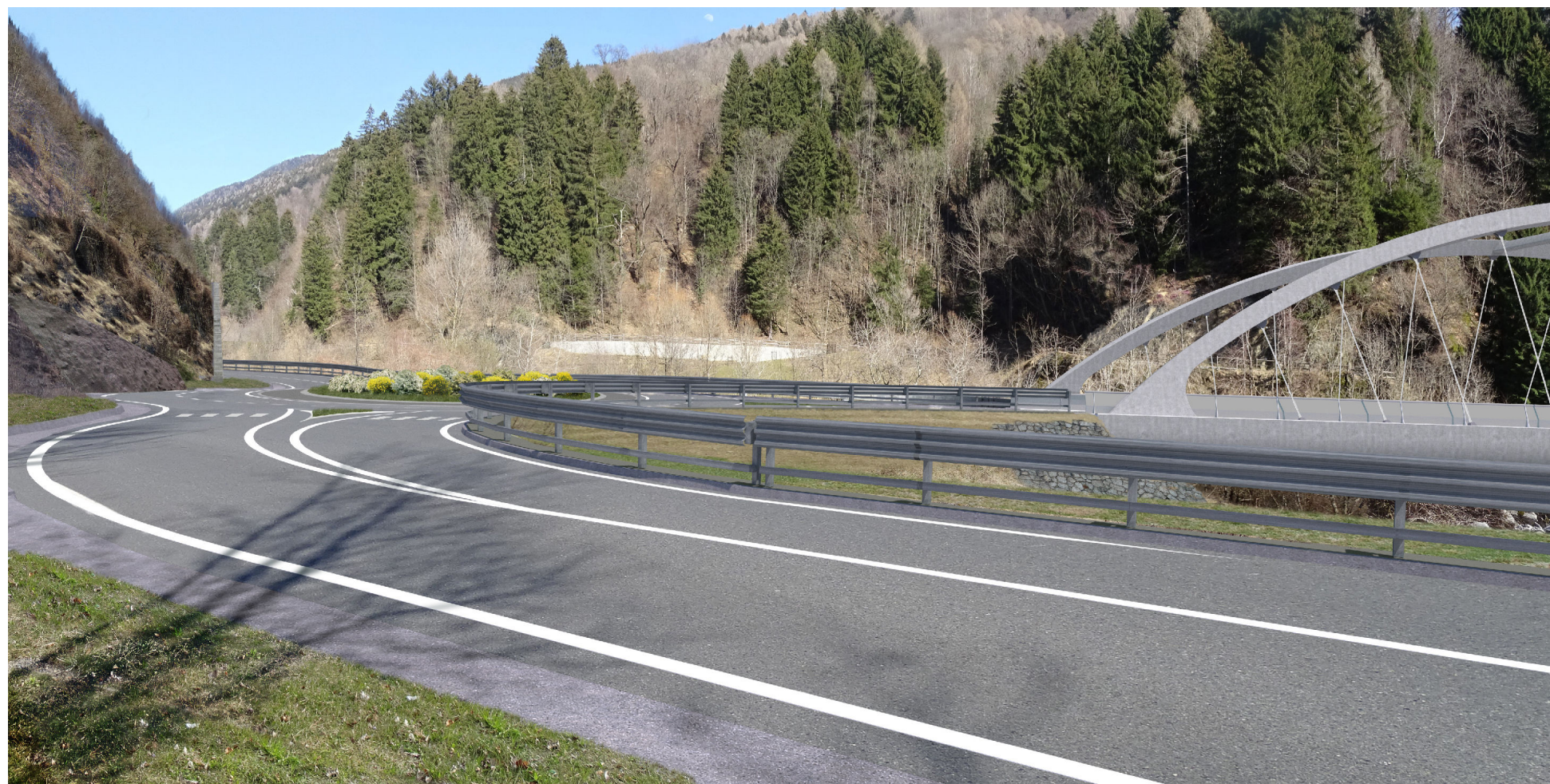
Stato di progetto con mitigazioni