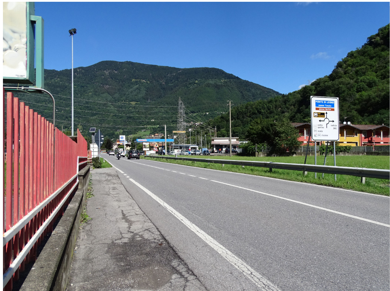
Stato di fatto