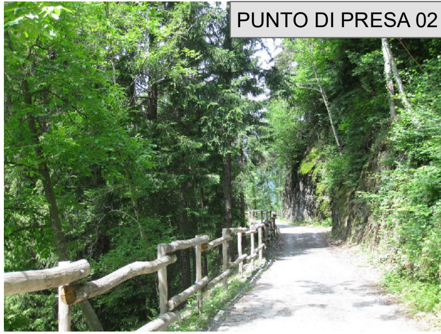
PUNTO DI PRESA 02