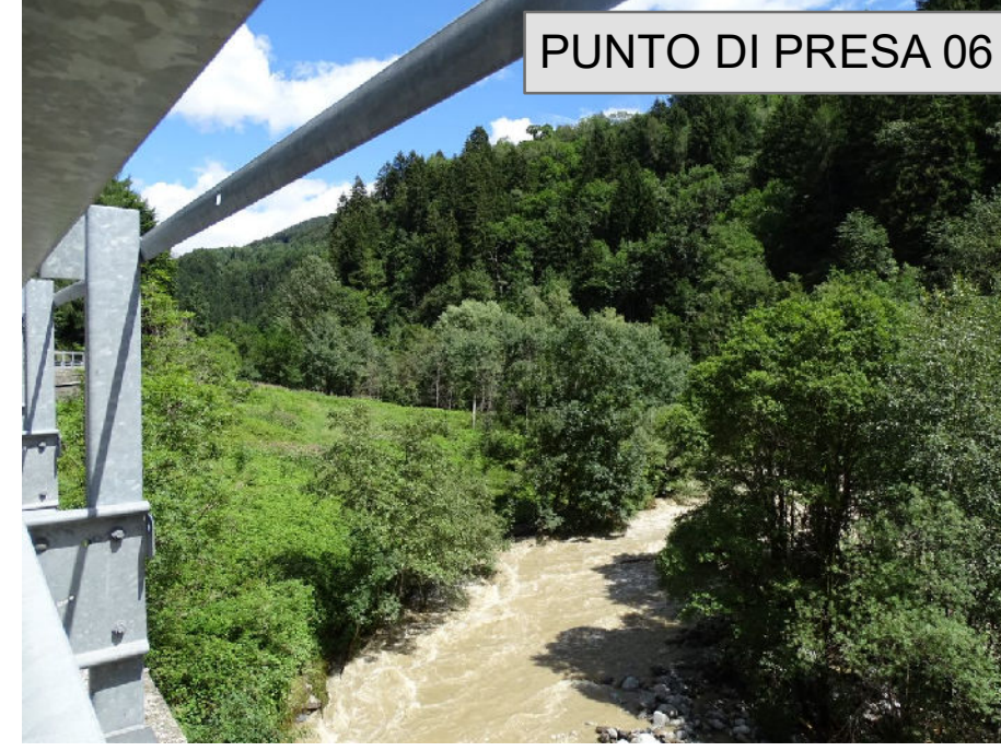
PUNTO DI PRESA 06