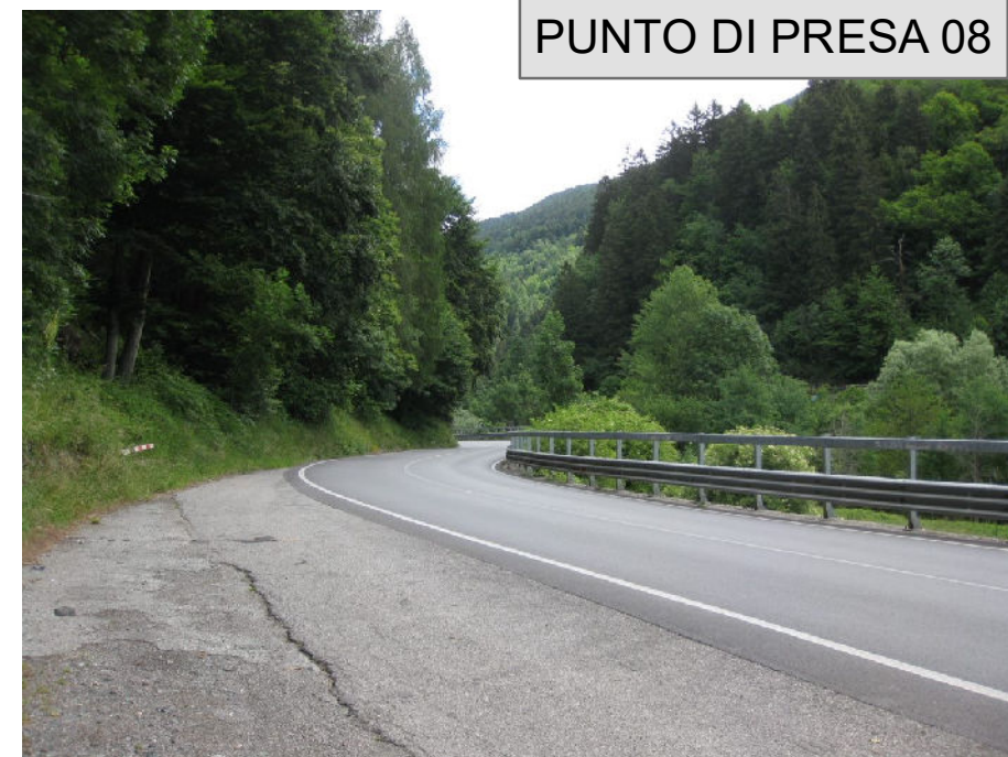
PUNTO DI PRESA 08