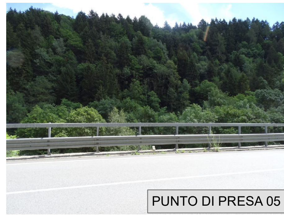
PUNTO DI PRESA 05