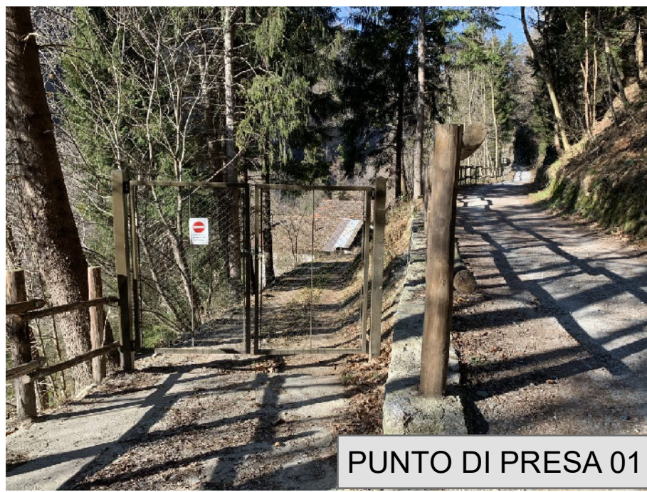
PUNTO DI PRESA 01