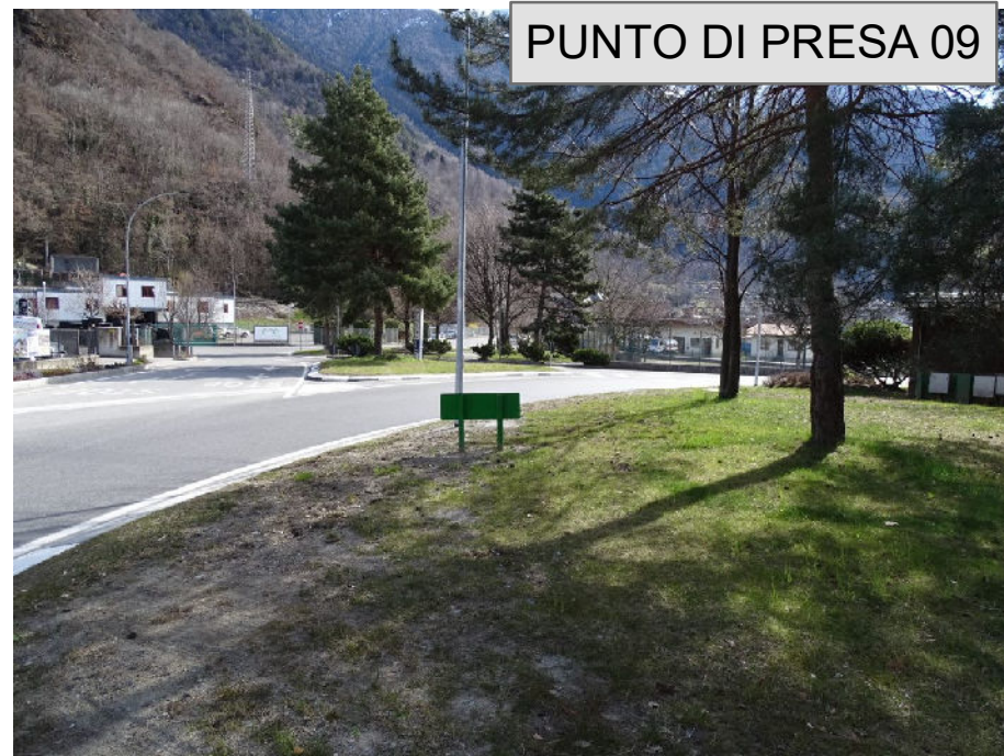
PUNTO DI PRESA 09