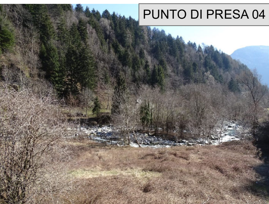
PUNTO DI PRESA 04