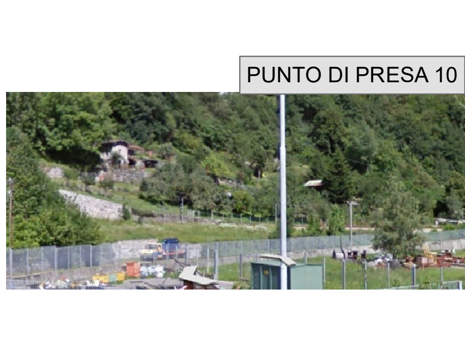
PUNTO DI PRESA 10