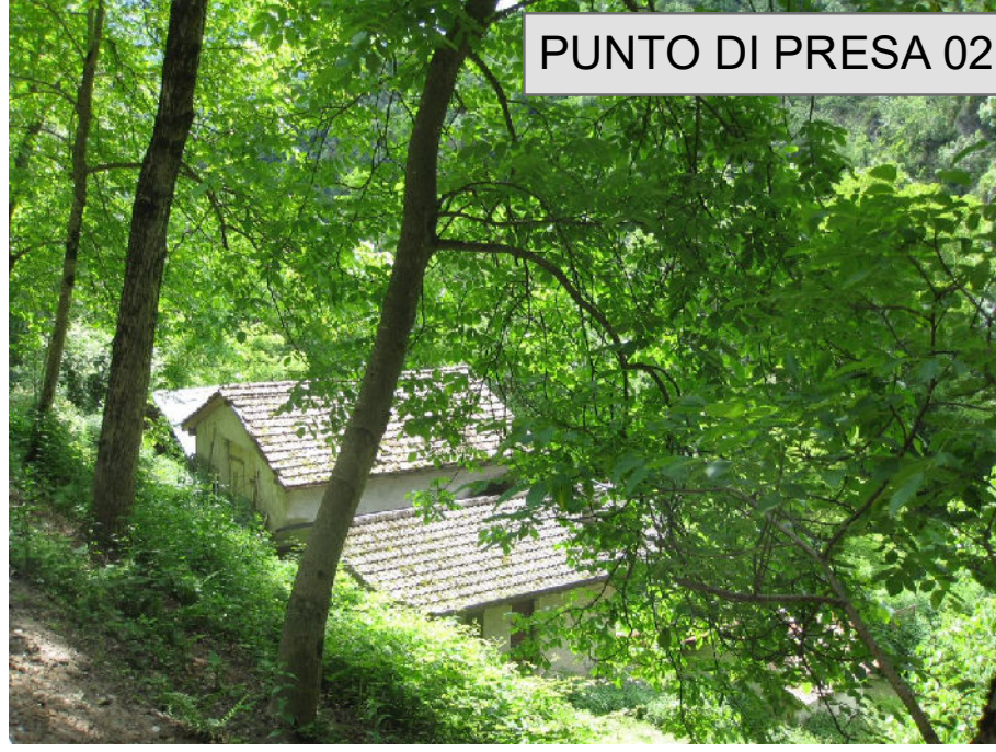
PUNTO DI PRESA 02