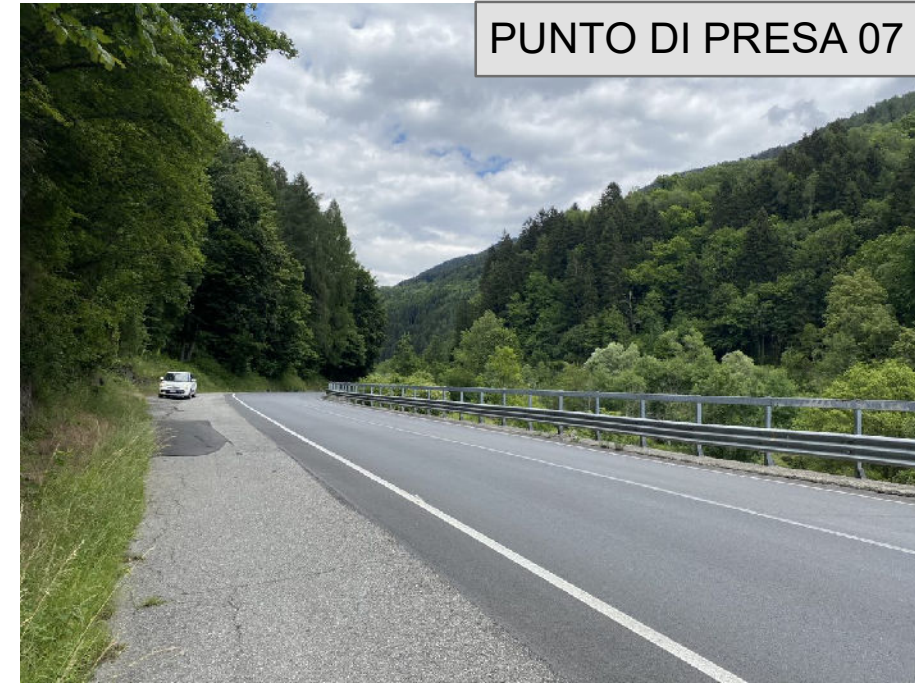
PUNTO DI PRESA 07