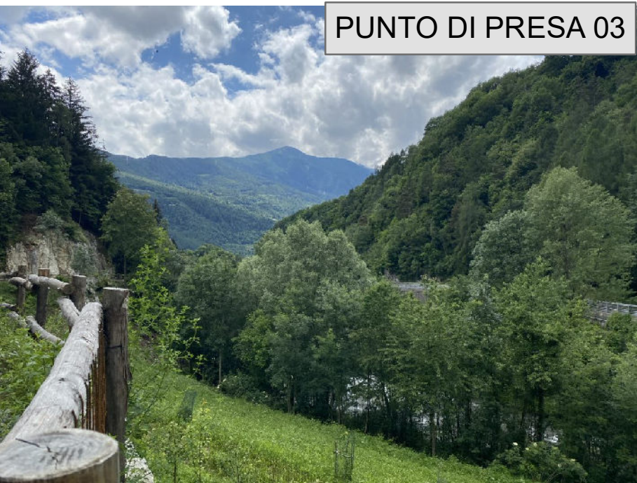
PUNTO DI PRESA 03