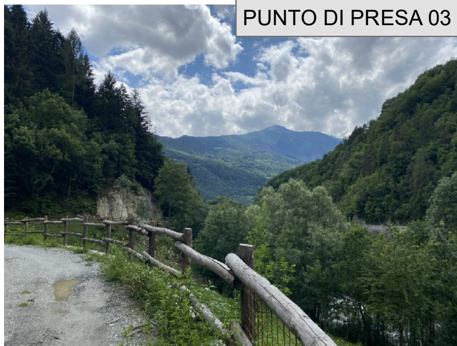
PUNTO DI PRESA 03