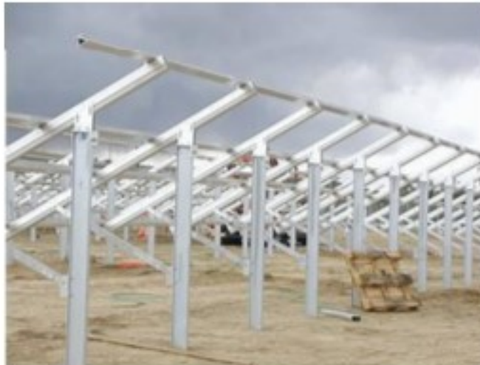
Fig. 2 Strutture di sostegno moduli completamente riciclabile e facilmente estraibili dal suolo in fase di dismissione.