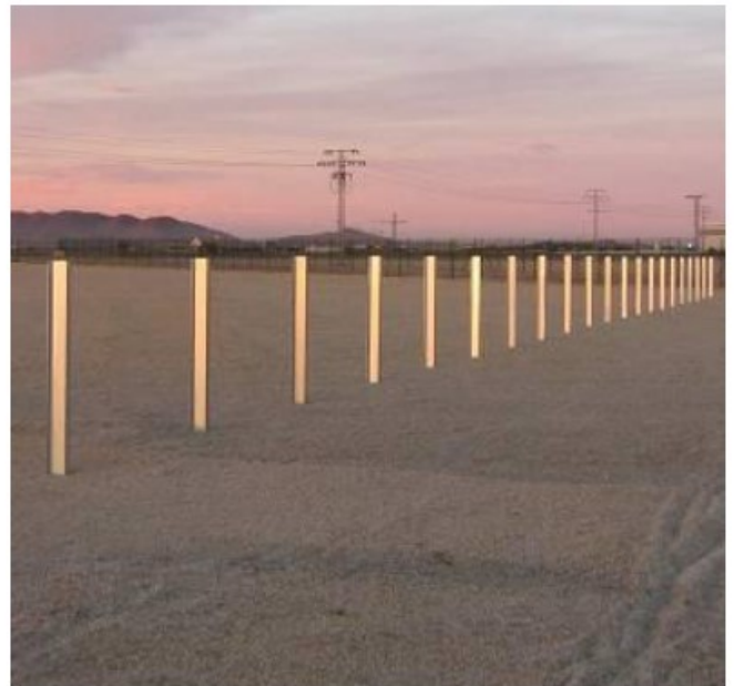
Fig.3 I pali di fondazione vengono infissi nel terreno e saranno estratti con estrema facilità e rapidità grazie all'utilizzo di mezzi appositamente progettati.