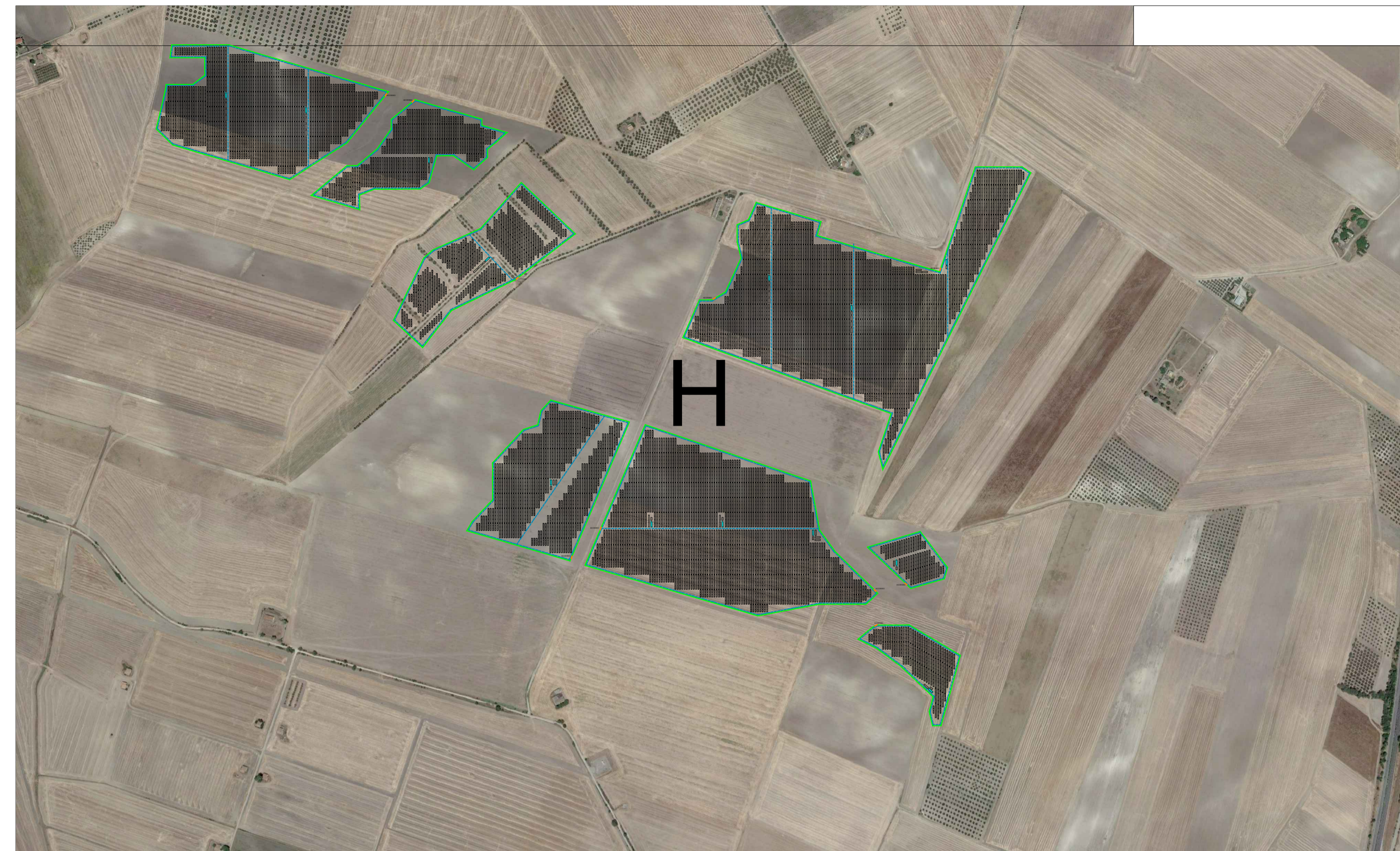
SETTORE H - impianto fotovoltaico parte Nord