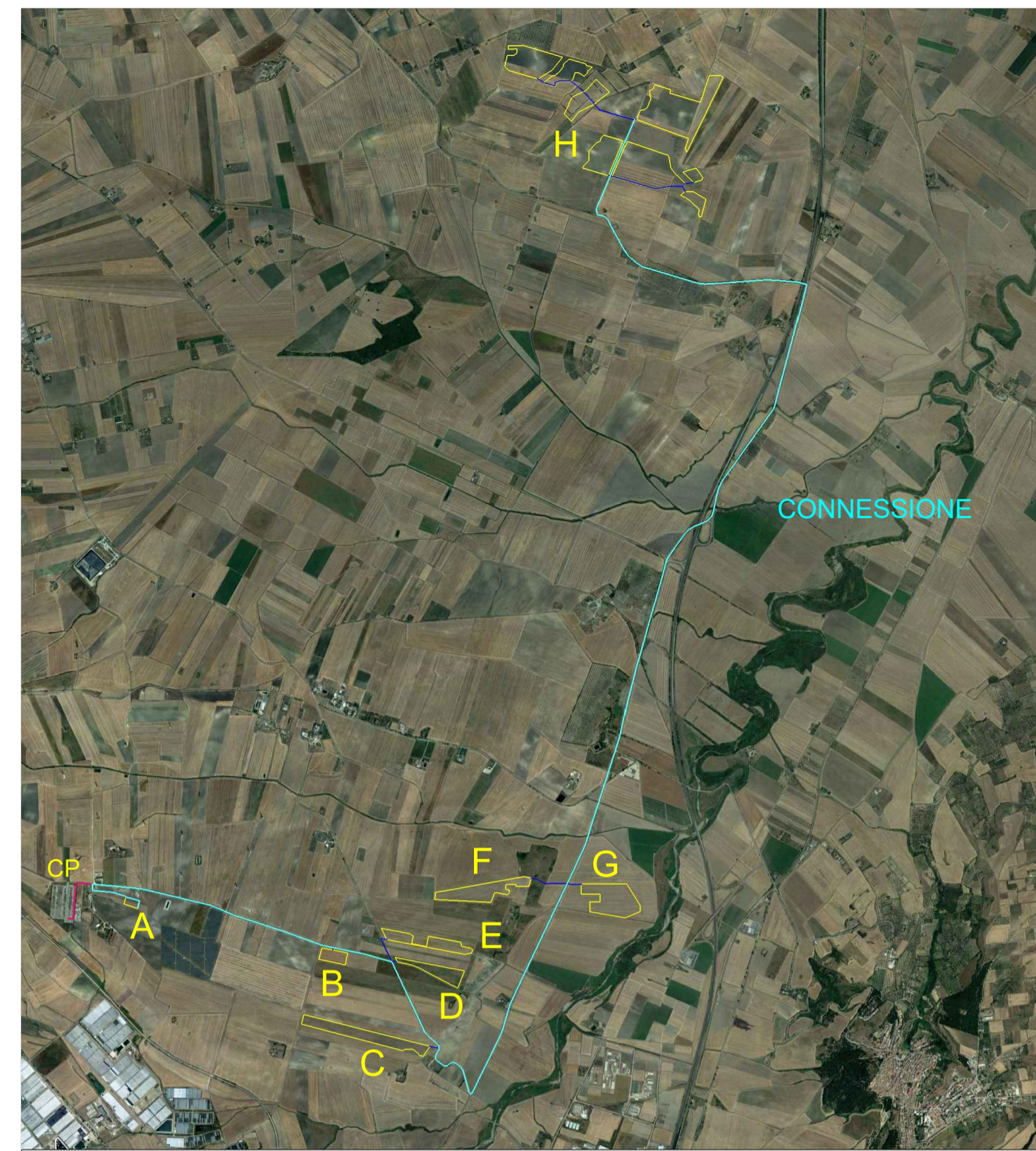
CONNESSIONE IMPIANTO - percorsi MT e AT