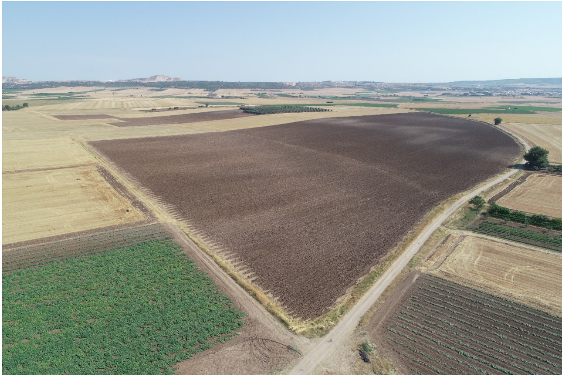
Figura 5: Visuale panoramica Campo 2 – vista da sud