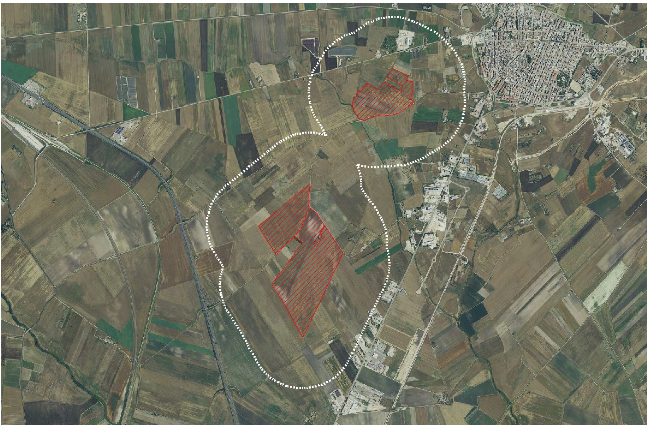
Figura 1. Mappa con indicazione dell'area di intervento (retino rosso) e relativo buffer di 500 m (tratteggio bianco)

La destinazione urbanistica dei terreni interessati dalla realizzazione del presente parco eolico, desunta dai vigenti strumenti di gestione territoriale del Comune di Apricena (FG) risulta essere classificata come Zona di tipo E "Zona agricola normale".