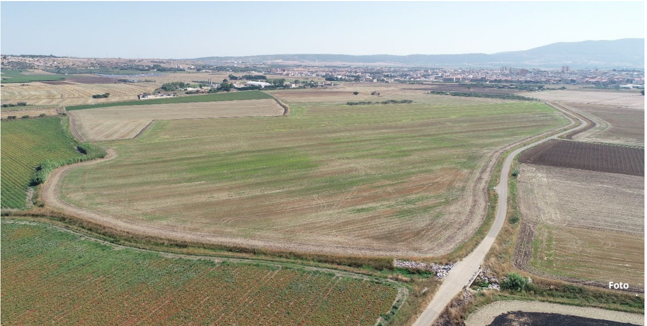
Figura 3: Visuale panoramica Campo1 – vista da sud-ovest