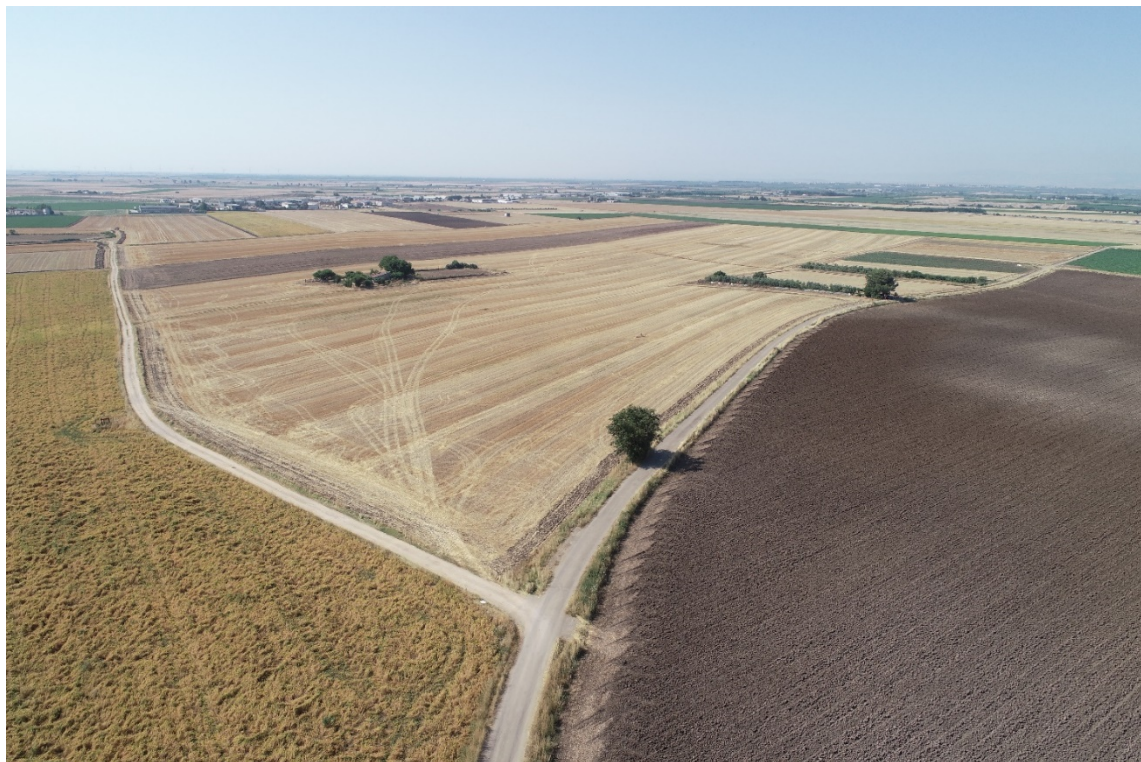
Figura 6: Visuale panoramica Campo 2 – vista da nord