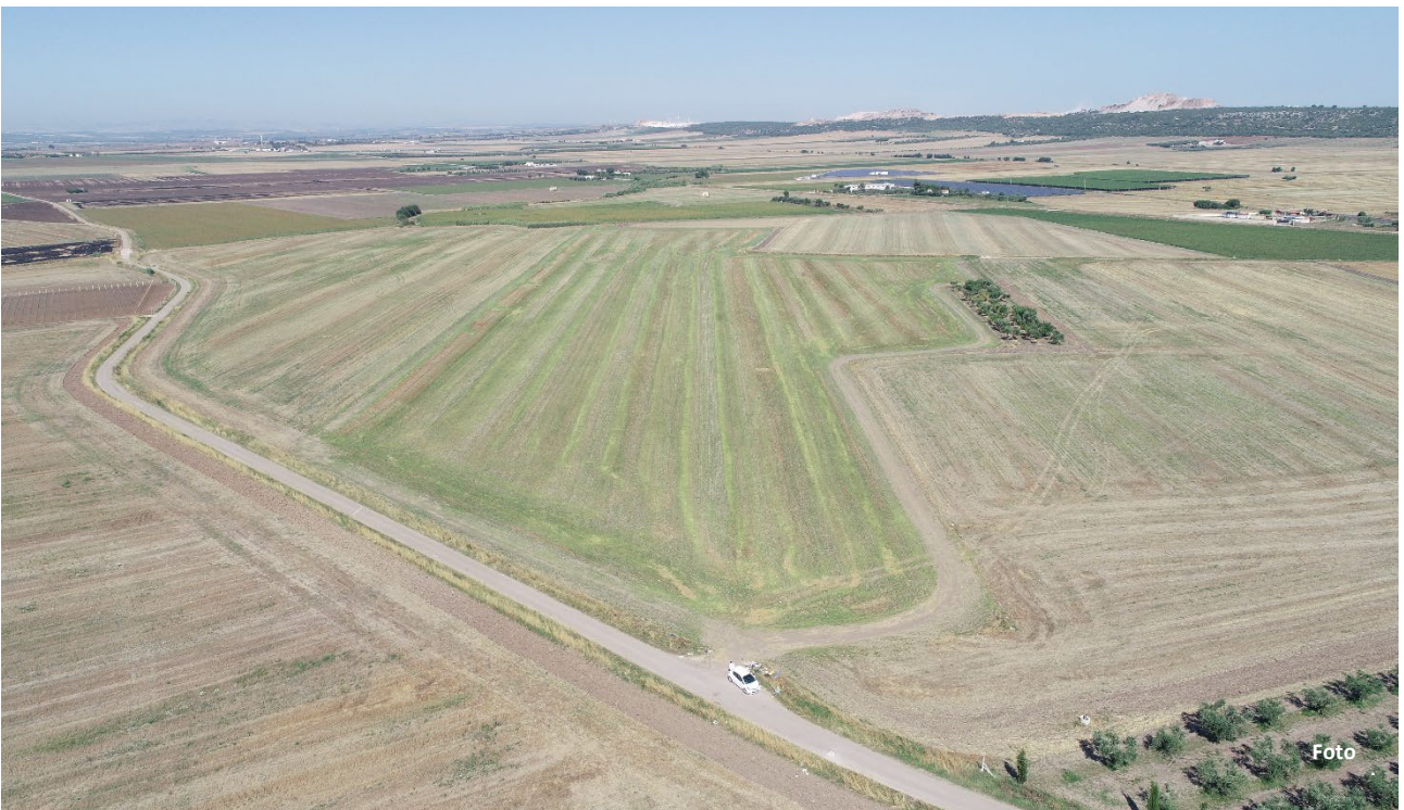
Figura 4: Visuale panoramica Campo1 – vista da nord