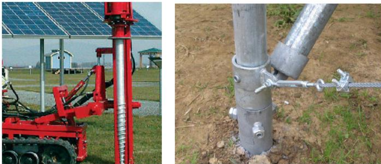
Fig. 4 – Infissione vite krinner e collegamento fra il montante del telaio verticale e la vite di fondazione

Ciascuna struttura di sostegno dei moduli di conversione fotovoltaica è sostenuta da un sistema di fondazione realizzata mediante infissione per rotazione di viti in acciaio zincato di tipo Krinner. Le viti di tipo Krinner di diametro di 12 cm, hanno una lunghezza e una profondità di infissione che può variare in funzione del tipo di terreno.