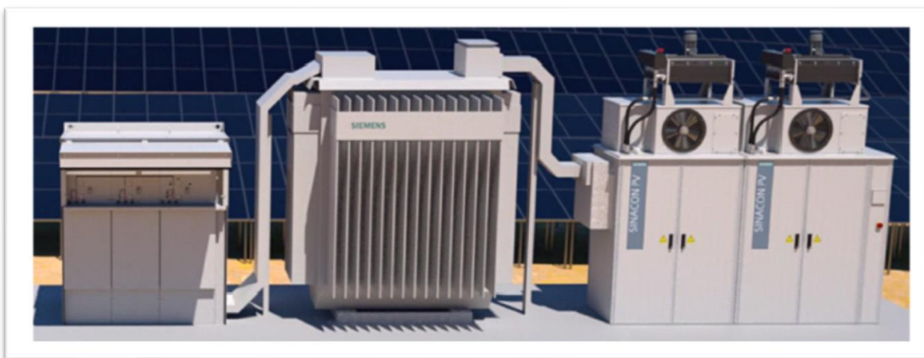
Fig. 1 – Cabina elettrica Power-Skid

L'impianto in oggetto sarà connesso alla rete del distributore in un'apposita cabina elettrica di consegna, mentre per la conversione della corrente si realizzerà una cabina di trasformazione.