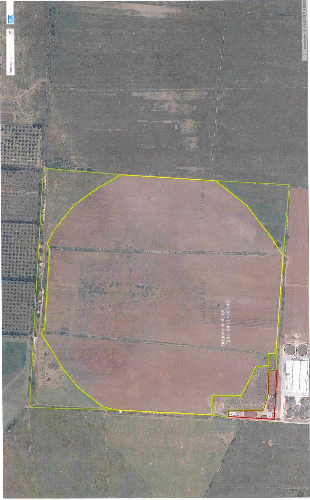
Ortofoto 2013, Comune di Sassari, Loc. Piano di Monte Casteddu, Scala 1:5000