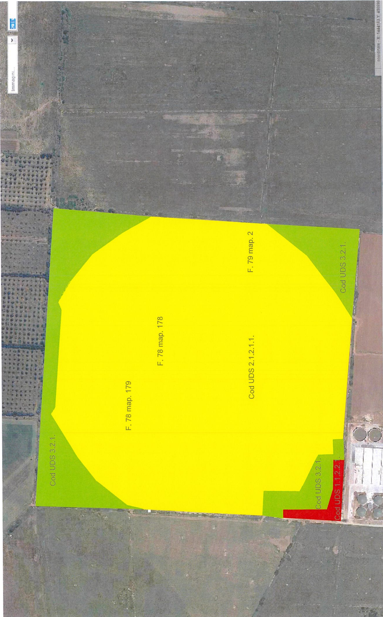
Ortofoto 2013, Comune di Sassari, Loc. Piano di Monte Casteddu, Scala 1:5000