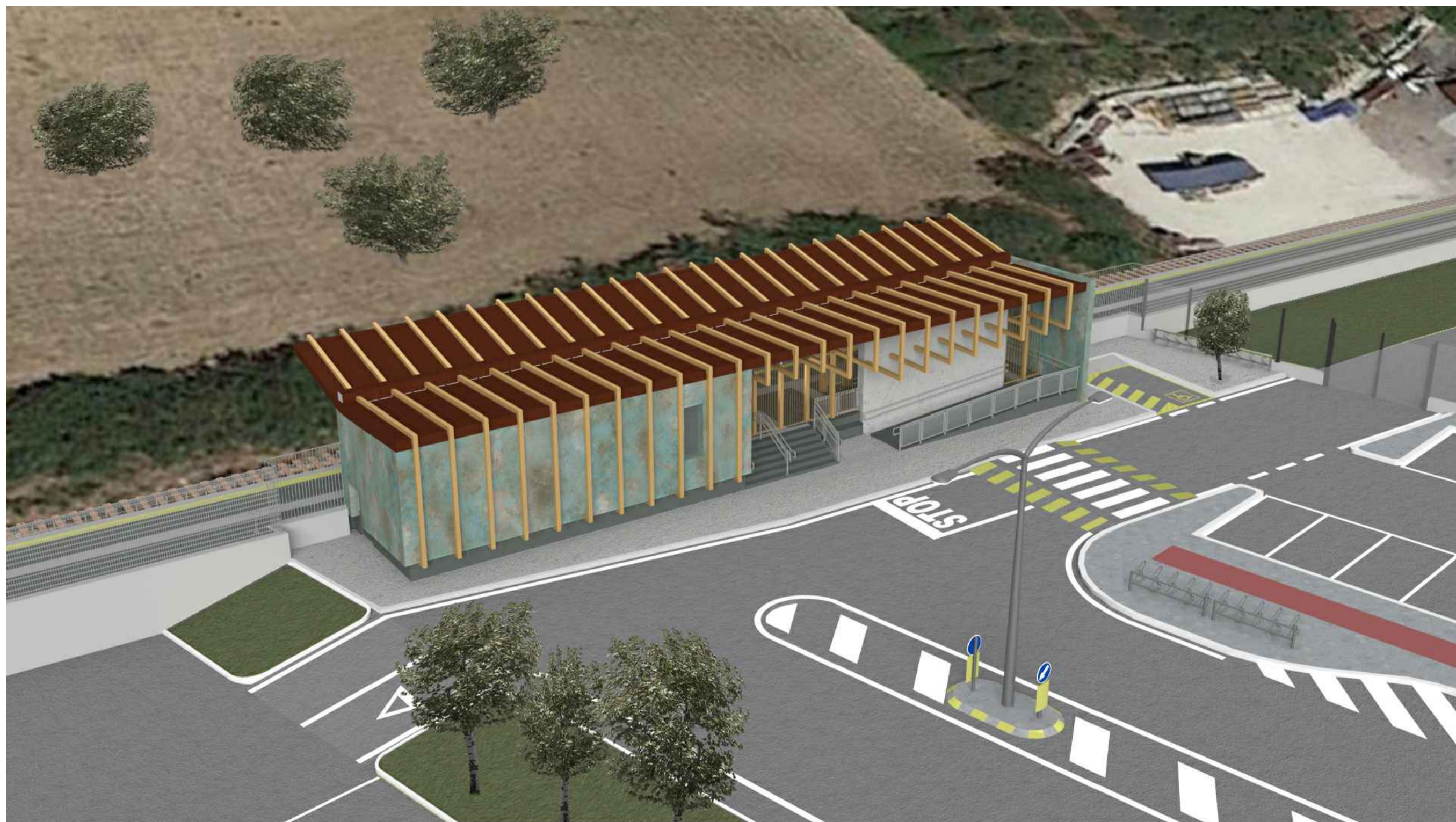
Vista fermata Tolentino Campus lato centro commerciale