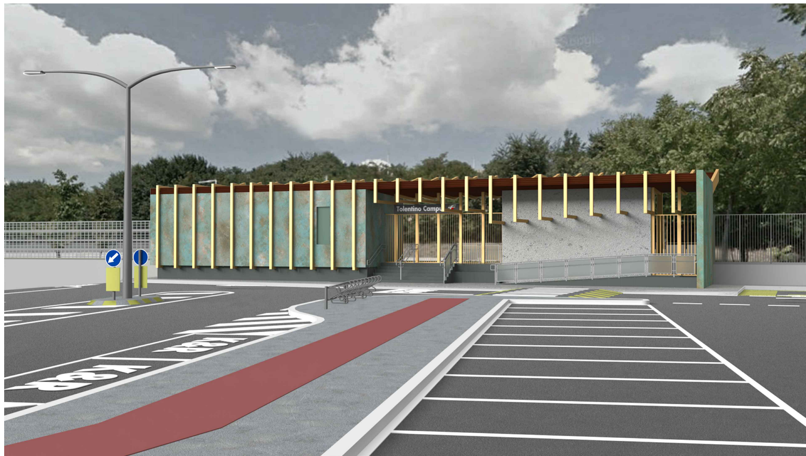
Vista fermata Tolentino Campus frontale Via Contrada Pace