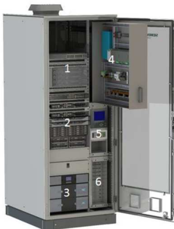
Figura 1 - Esempio di un Armadio SCADA

L'armadio SCADA sarà installato nella sala di controllo dell'edificio della sottostazione, il luogo di installazione deve garantire una temperatura ambiente compresa tra 15 °C e 25 °C.