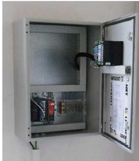
Figura 3 - Quadro Trasduttori

L'armadio richiede una tensione di alimentazione di 230 Vac, il consumo energetico approssimativo è compreso tra 0,8 e 3 kVA a seconda dei trasduttori installati.