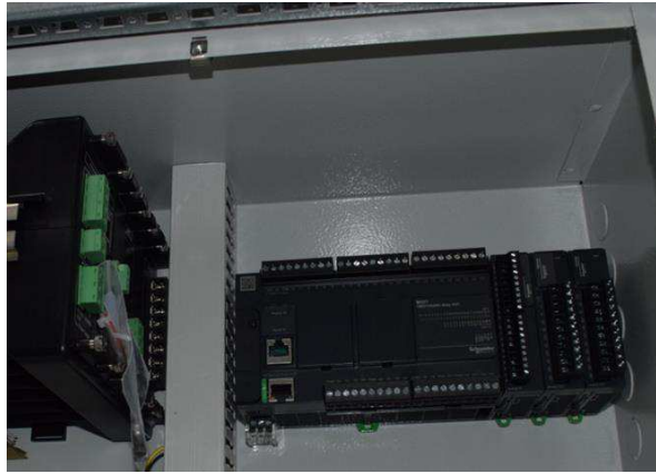
Figura 4 - Dettaglio di installazione del PLC