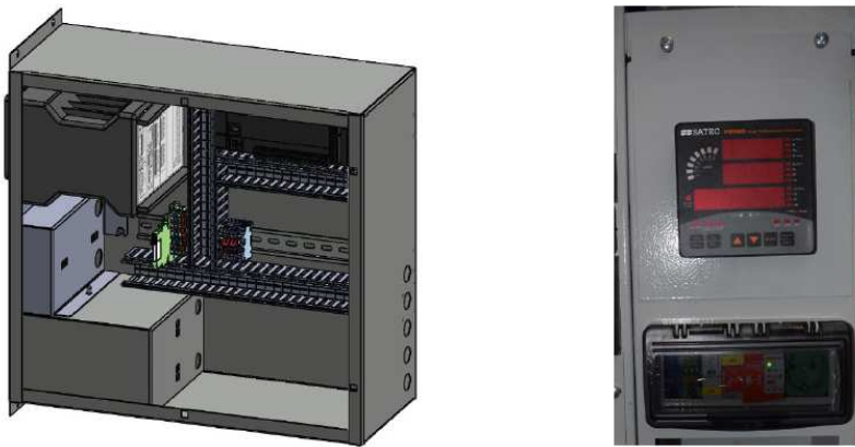
Figura 2 - Trasduttori di misura

L'armadio trasduttori viene impiegato per il trasferimento dei valori di misura del punto di connessione (P, Q, V, f, ...), dei trasformatori di corrente (TA) e dei trasformatore di tensione (TV).