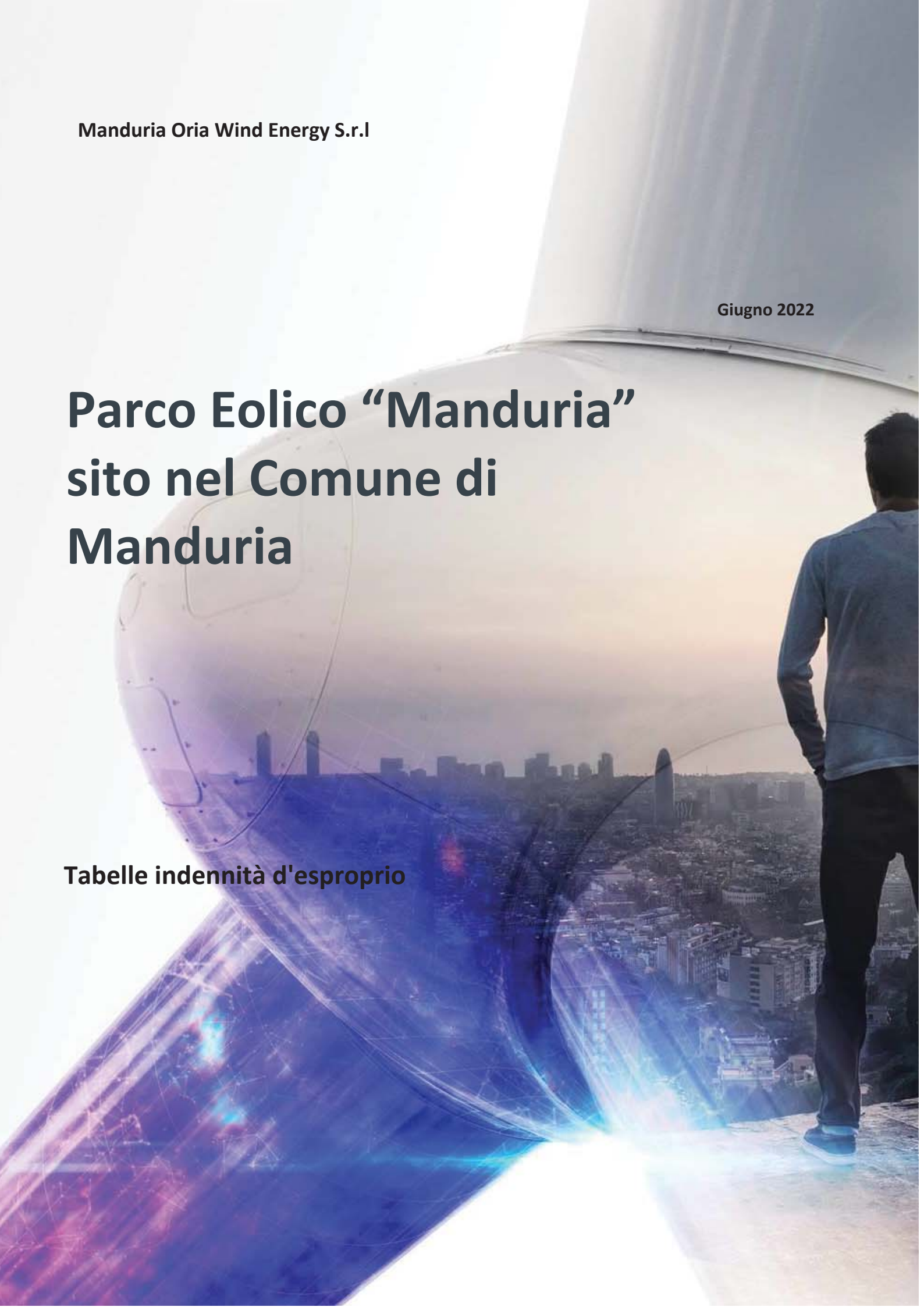
Tabelle indennità d'esproprio