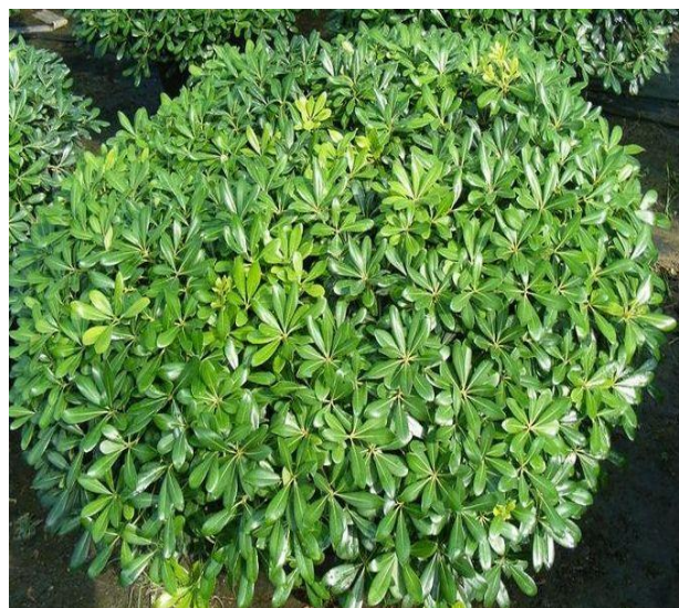
Pittosporum Tobira Nanum

La forma tondeggiante e compatta del Pitosforo e il portamento allargato della Lantana si alternano in contrapposizione al già descritto rosmarino, che si adagia lungo l'alzato, arricchendone l'aspetto.