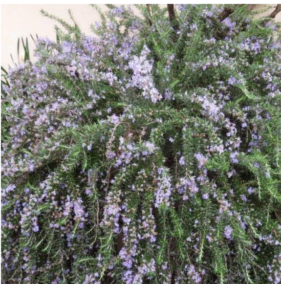
Rosmarinus Officialis Prostratus

Infine, per spezzare la lunghezza del fronte del contenitore, è stato inserito il Rosmarino Prostrato ( Rosmarinus Officialis Prostratus ), arbusto sempreverde a portamento ricadente e dalle infiorescenze color violetto.