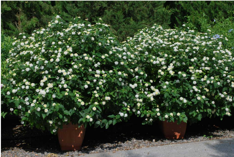
Lantana Sellowiana Alba