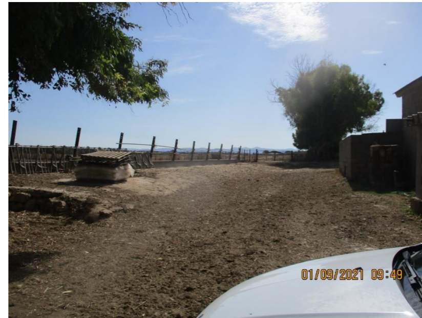
Ingresso corte stalle