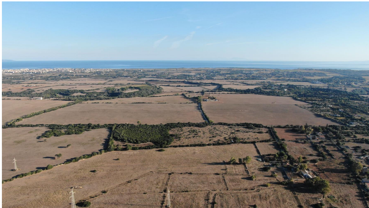
Vista da drone 20/10/21