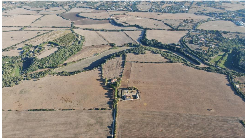
Viste del centro aziendale e della abitazione