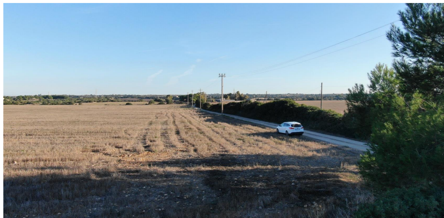
Ingresso al predio aziendale