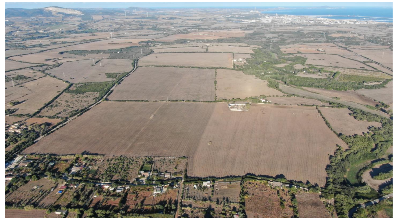
Vista in direzione ovest