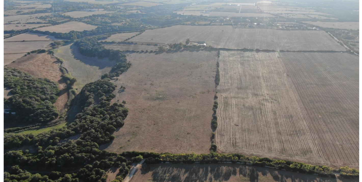
Rio D'ottava sul lato nord