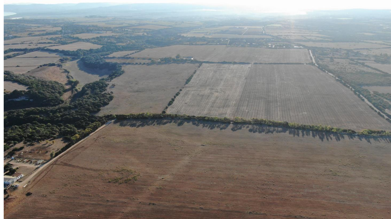
Rio D'ottava sul lato nord