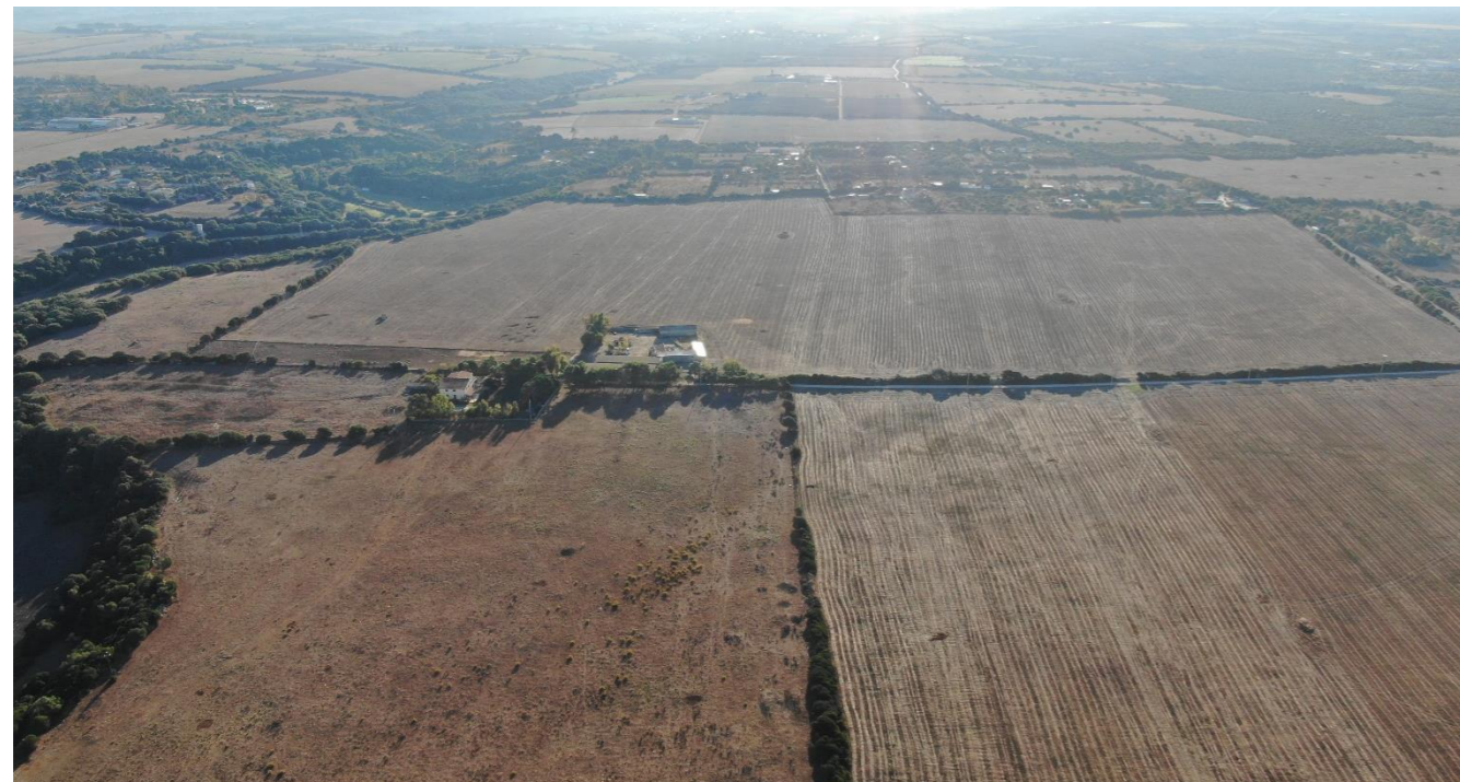
Vista in direzione est