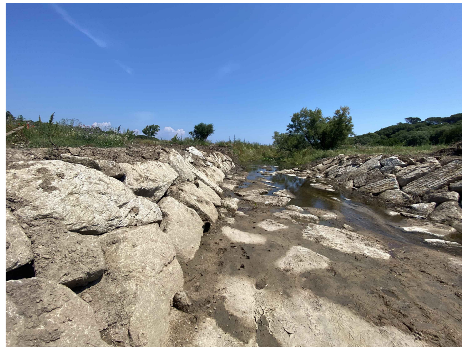
Esempio di risagomatura fondo alveo con scogliera in massi ciclopici