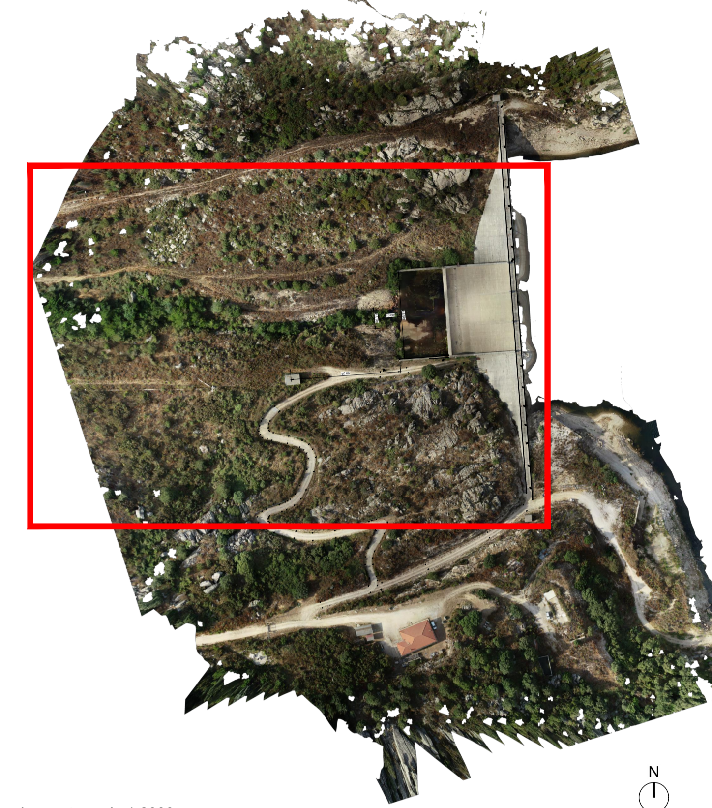
Inquadramento scala 1:2000