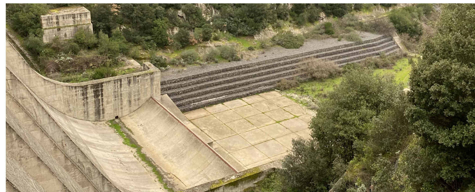
Esempio di sistemazione con gabioni (Vasca di calma diga alto Temo)