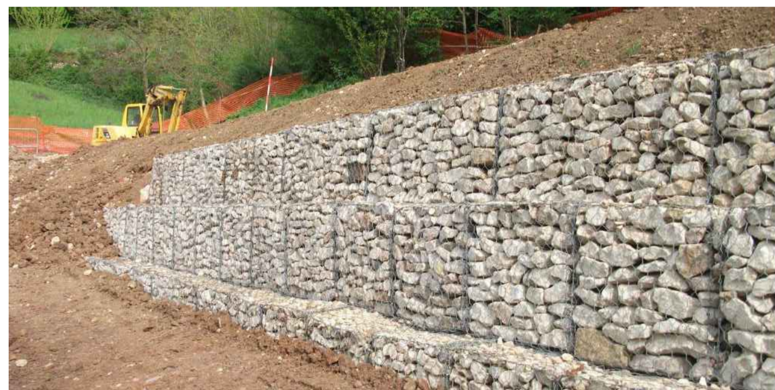
Esempio di sistemazione con gabioni