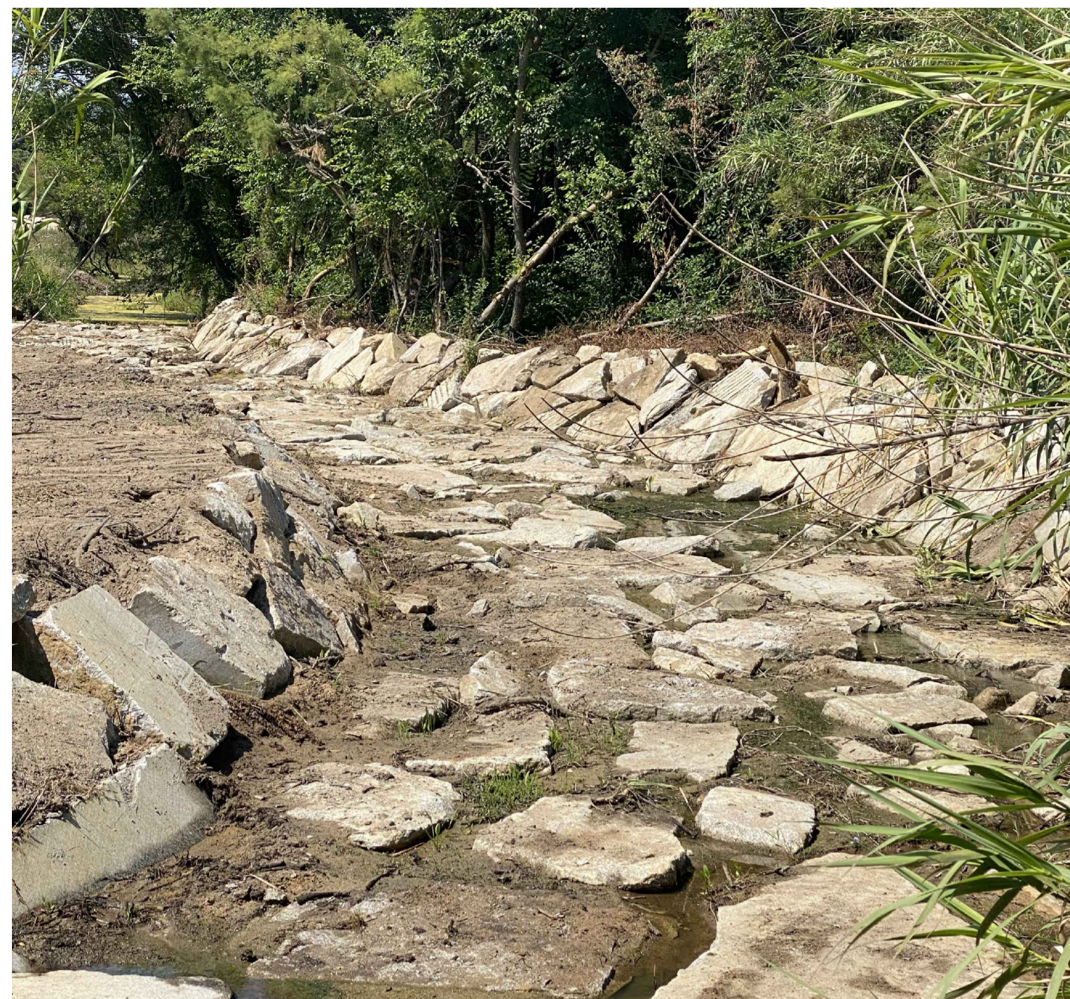
Esempio di risagomatura fondo alveo con scogliera in massi ciclopici