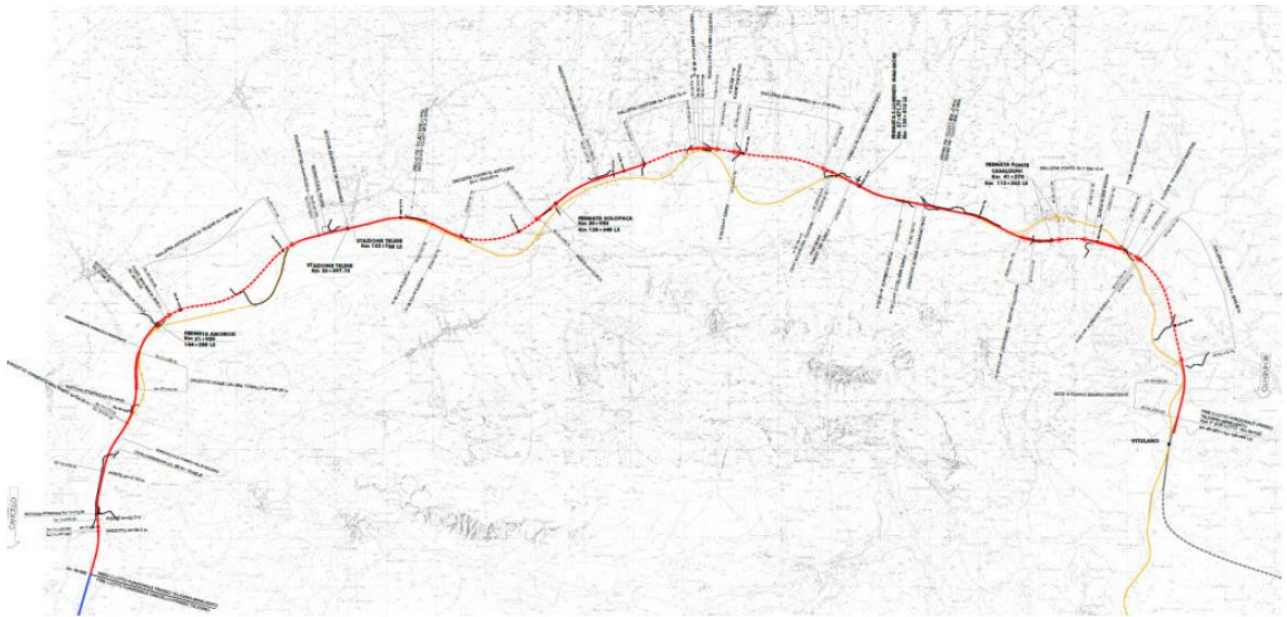
Figura 1: Corografia della Tratta Frasso Telesino - Vitulano

Il tracciato di variante si estende per 30,387 km con una velocità di tracciato di 180 km/h, tranne che per due tratti a 160 km/h rispettivamente di circa 1.7 km nella zona di Amorosi e di circa 300 m prima dell'allaccio alla Linea Storica lato Vitulano, mentre nella tratta compresa tra le fermate di Solopaca e S. Lorenzo Maggiore la velocità di tracciato è innalzata a 200 km/h.